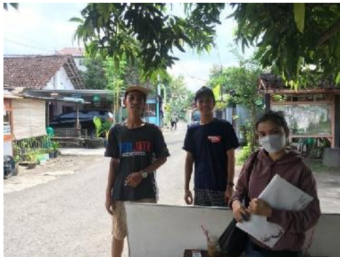
Wawancara dengan salah satu tukang parkir di destinasi wisata Kali Gajah Wong