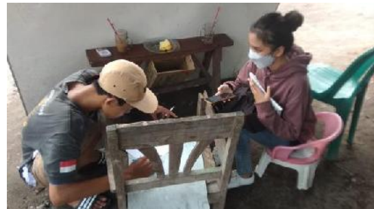
Wawancara dengan salah satu tukang parkir di destinasi wisata Kali Gajah Wong