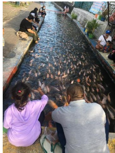
Salah satu atraksi wisata di destinasi wisata Kali Gajah Wong yaitu memberi makan ribuan ikan yang ada di saluran irigasi