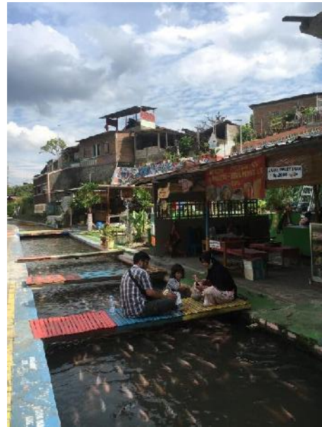
Kondisi destinasi wisata Kali Gajah Wong