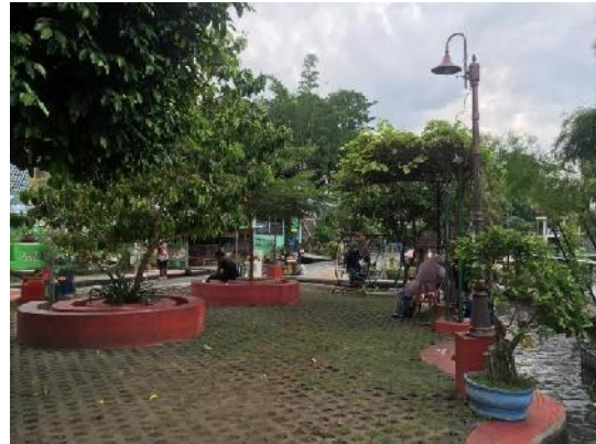
Keadaan lingkungan destinasi wisata Kali Gajah Wong