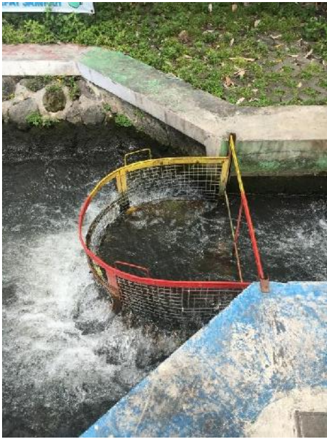
Penyaring sampah di saluran irigasi