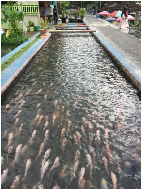
Ribuan ikan yang dipelihara masyarakat Kampung Mrican