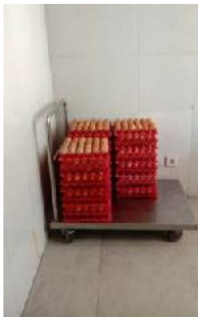
Bahan Yang Sudah Diterima