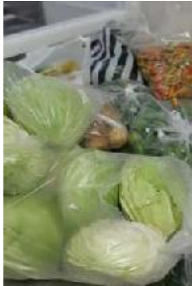
Bahan Yang Sudah Dilakukan Quality Control dan Akan Menunggu Disimpan