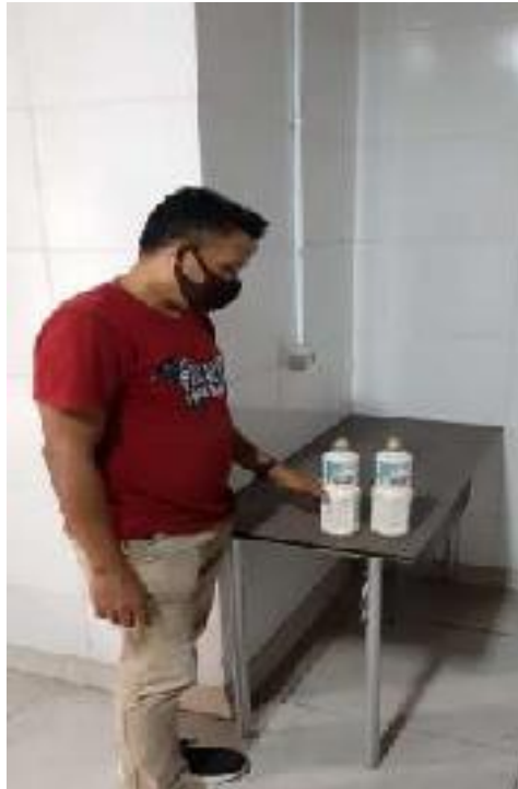
Penerimaan Bahan Dari Supplier