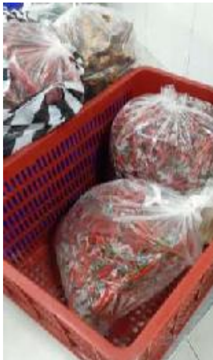
Bahan Yang Sudah Ditimbang