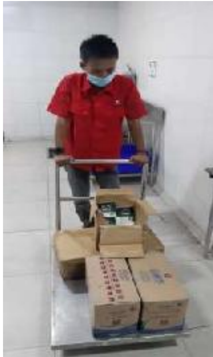
Penerimaan Produk Dari Supplier