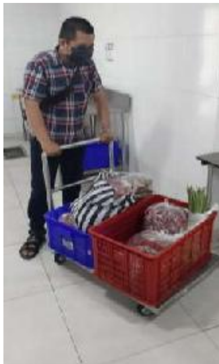
Penerimaan Sayuran Dari Supplier dan Akan Dilakukan Penimbangan