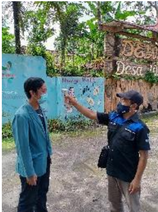
Penerapan protokol kesehatan (cek suhu)