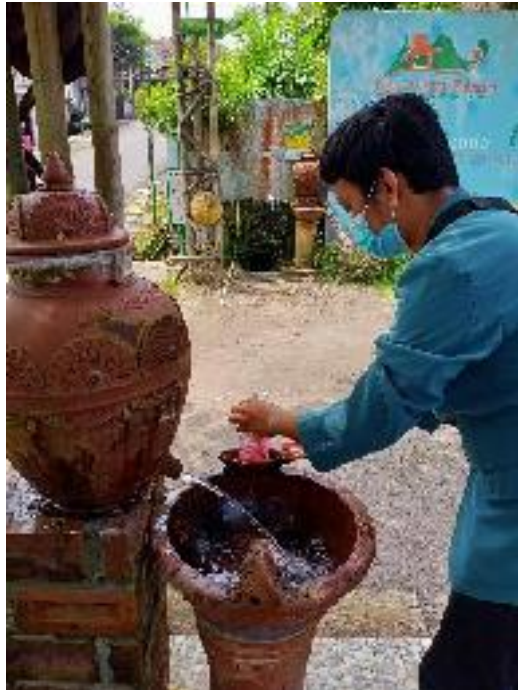
Penerapan protokol kesehatan (cuci tangan pakai sabun/CTPS)