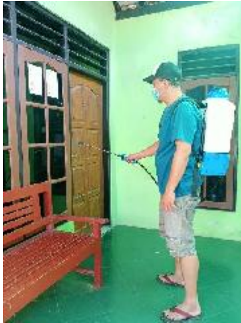
Penyemprotan cairan disinfektan ke setiap homestay