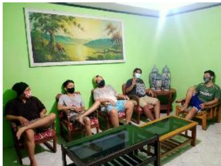
Tamu homestay Desa Wisata Pulesari