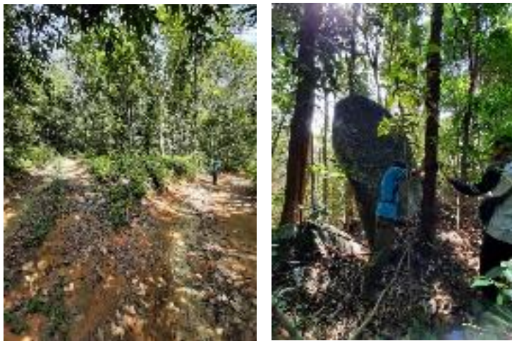
Survey Lapangan Di Kawasan Bukit Tulen Telase