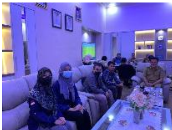
Diskusi Bersama Perangkat Desa, Pokdarwis, Masyarakat, dan Wakil Bupati terkait pembuatan Master Plan