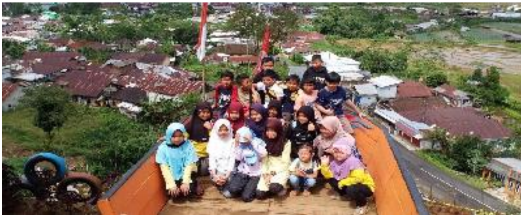
Kegiatan anak-anak SD Bersama Wali Murid dan Guru