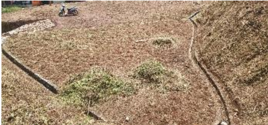
Persiapan Pembangunan Resto