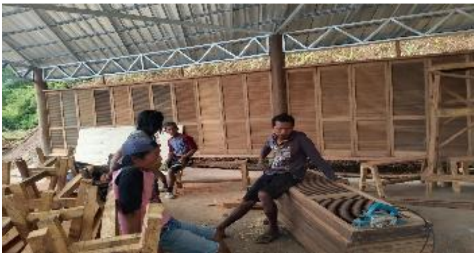
Koordinasi antar Pekerja dan Pengelola