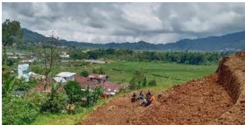
Pembersihan Lahan di Area Bukit Sumber : Dokumentasi Pribadi, 2021