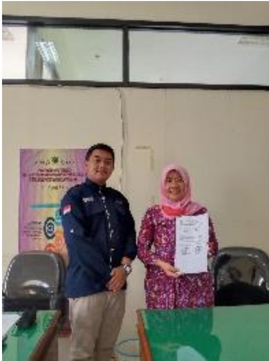
Pengajuan SK POKDARWIS di Dinas Pariwisata dan Kebudayaan Kabupaten Banjarnegara