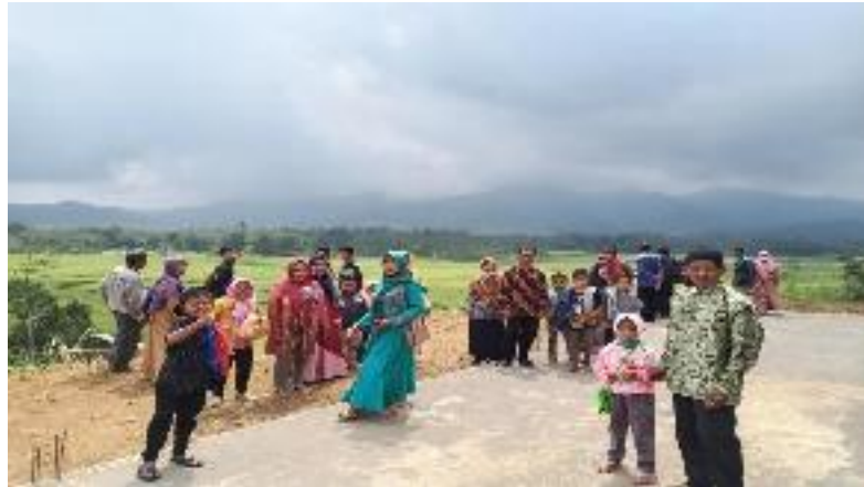
Wisatawan yang berkunjung di Destinasi Wisata Parakan Paradise