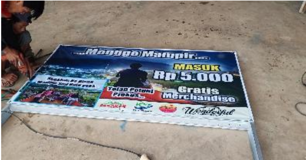
Pemasangan Banner Wisata