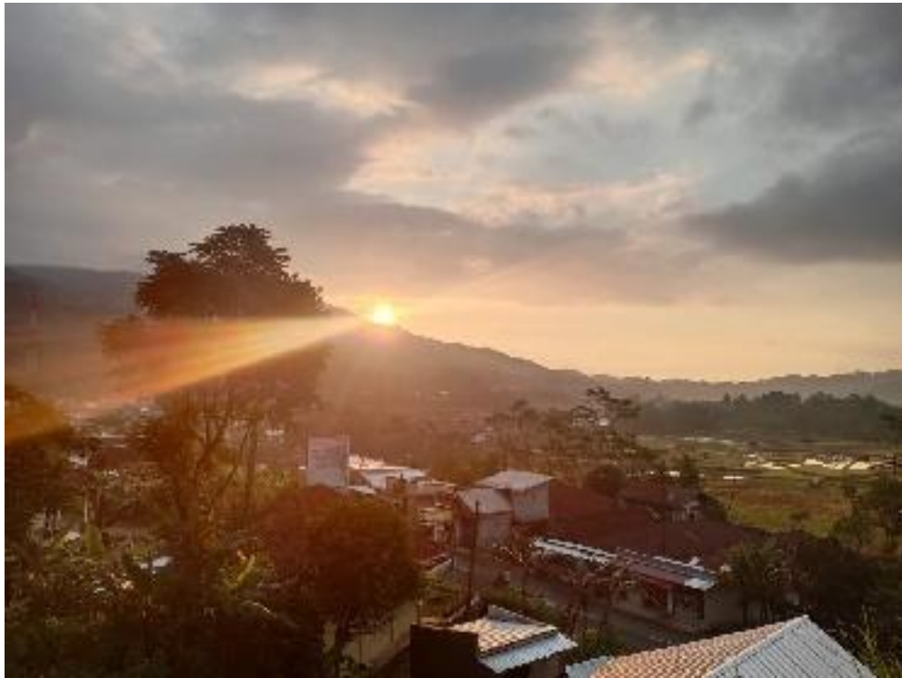
Pemandangan Sunset dari Destinasi Wisata Parakan Paradise