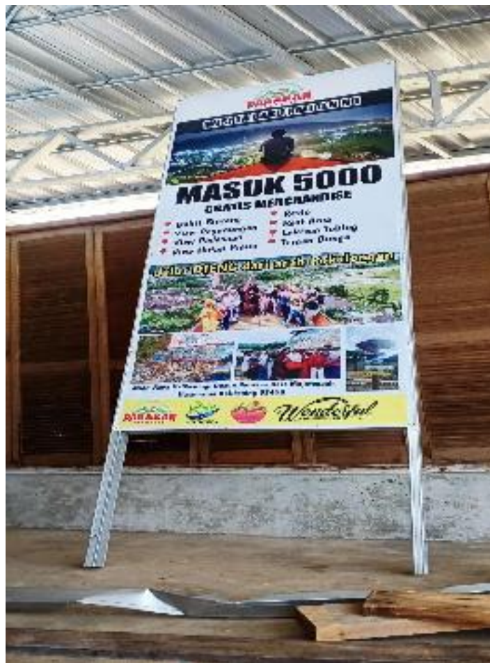
Banner Wisata Parakan Paradise