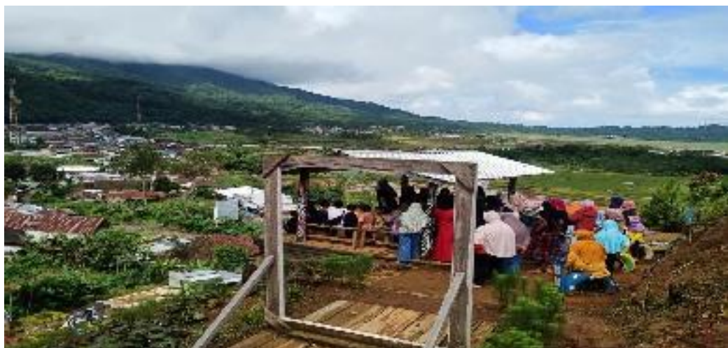
Kegiatan Sekolah Alam