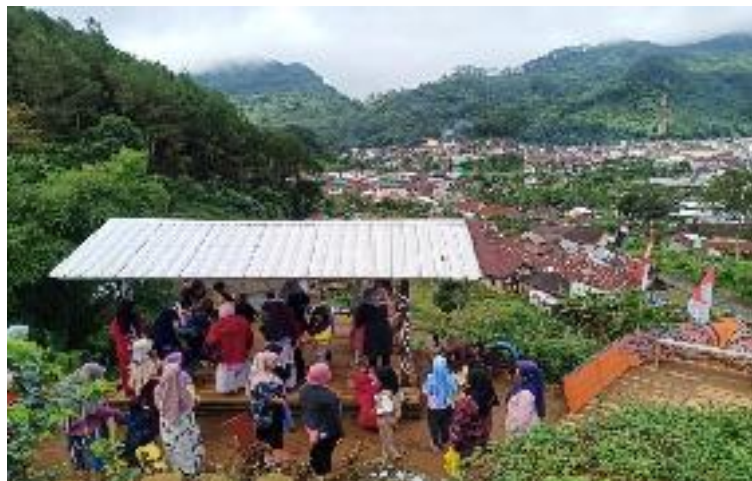
Kegiatan Sekolah Alam