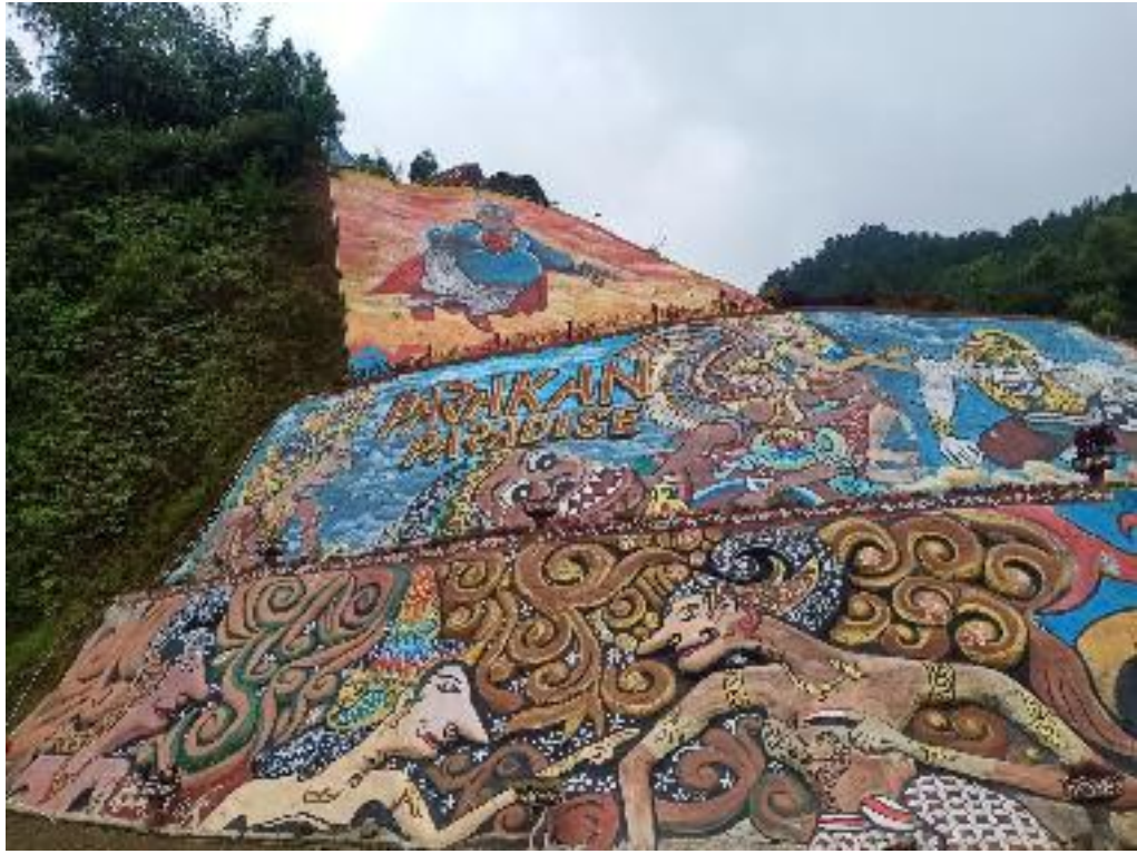
Lukisan Tebing Parakan Paradise