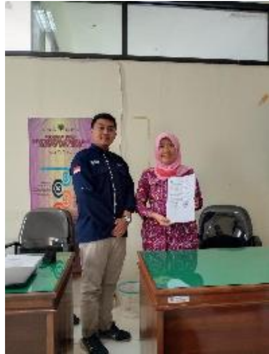
Pengajuan SK POKDARWIS di Dinas Pariwisata dan Kebudayaan Kabupaten Banjarnegara