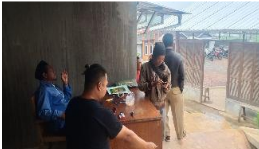
Koordinasi antar Pengelola Destinasi Wisata Parakan Paradise