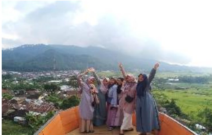
Kunjungan dari Reamaja Wanita