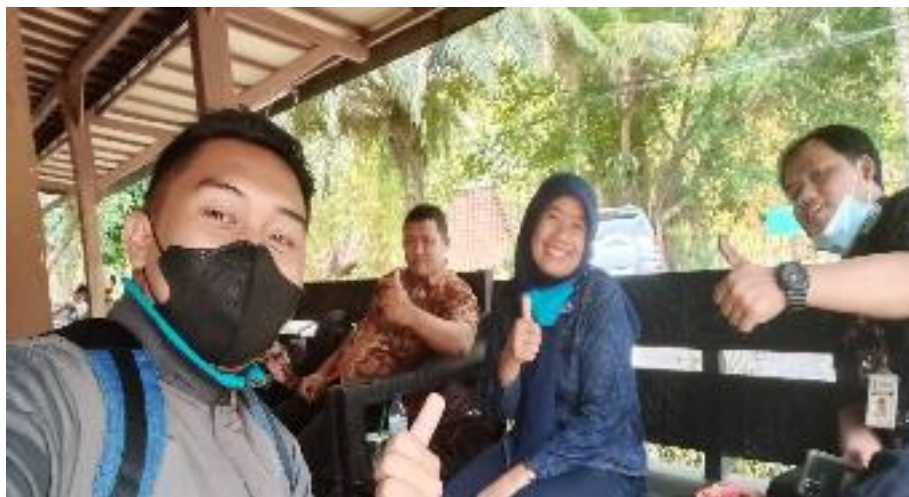
Kordinasi Pembuatan Kelompok Sadar Wisata Dokumentasi Pribadi, 2021