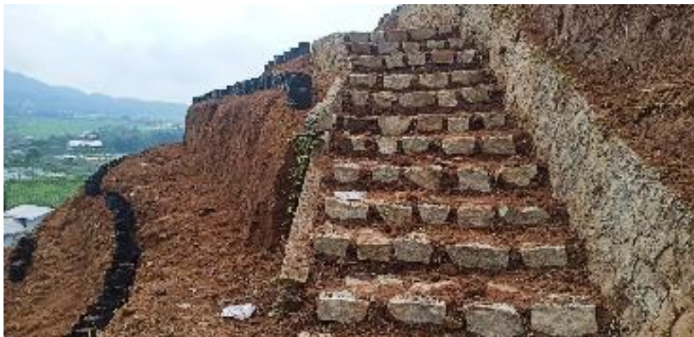
Pembangunan Akses Menuju Bukit Destinasi Wisata Parakan Paradise Sumber : Dokumentasi Pribadi, 2021