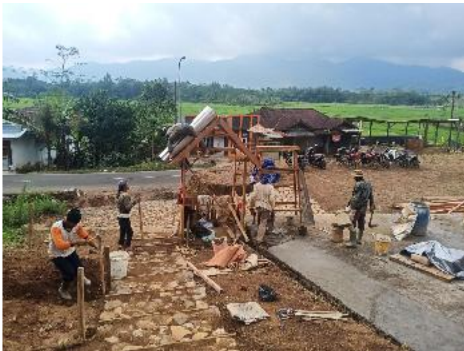
Proses Pembangunan Resto