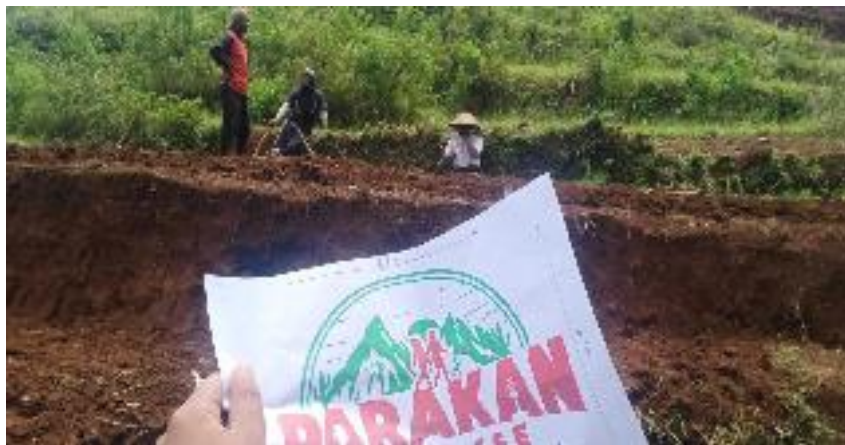
Pembersihan Lahan di Destinasi Wisata Parakan Paradise