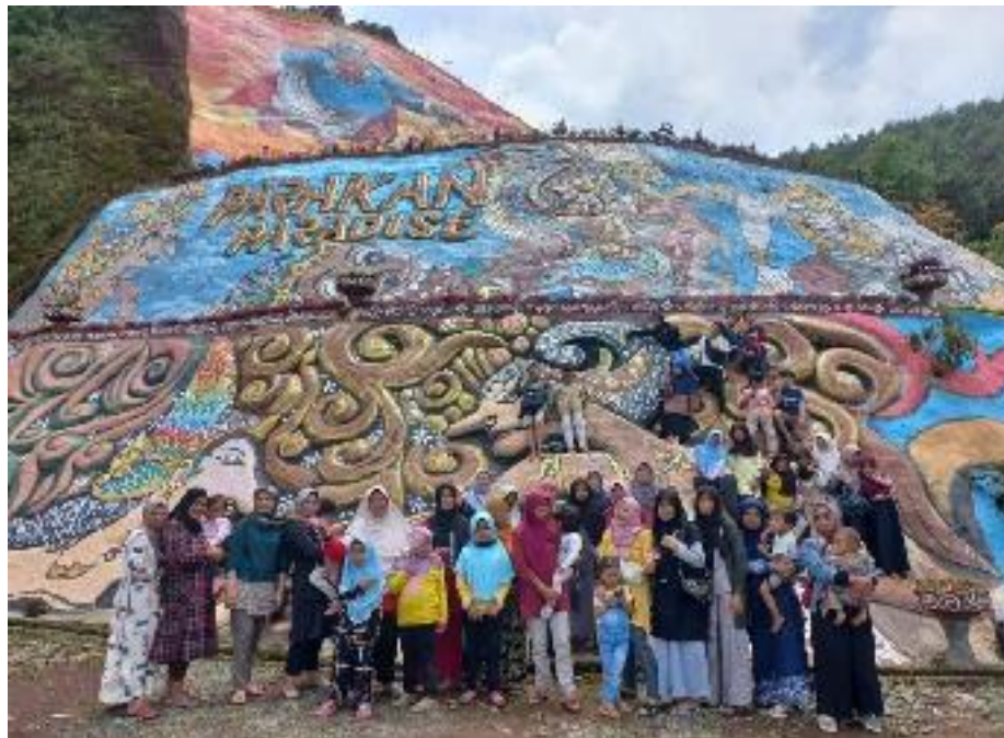
Kunjungan Wisata dari Wali Murid SDN 1 Kalibening