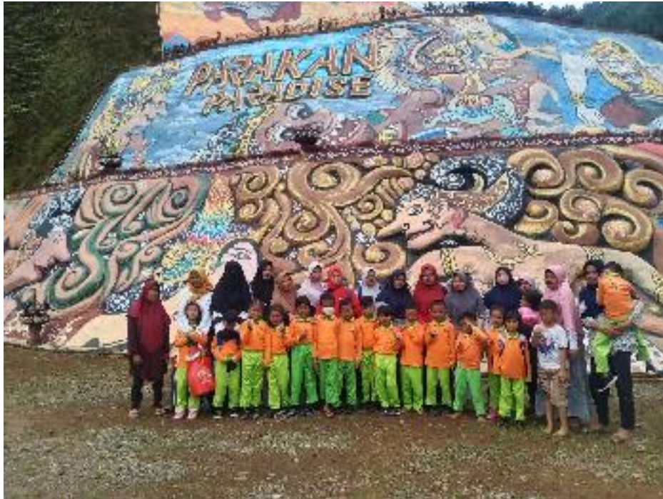
Kunjungan dari TK Majatengah