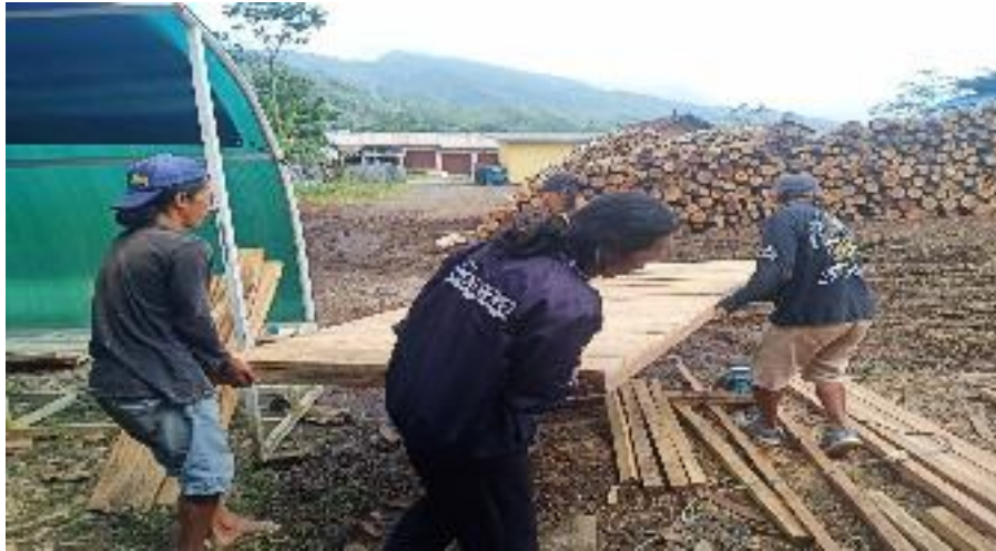
Persiapan Pembangunan Spot Foto