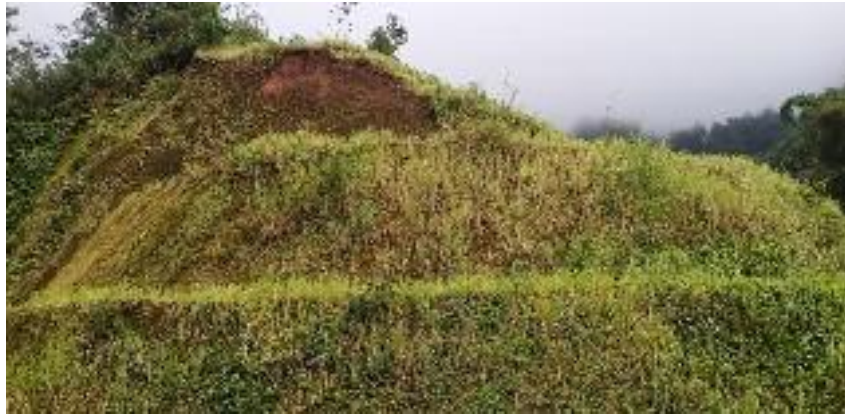
Kondisi Lokasi Sebelum dilakukan Pembangunan