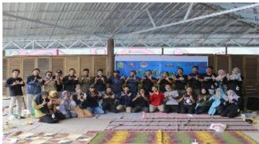
Kordinasi Wisata se Kecamatan