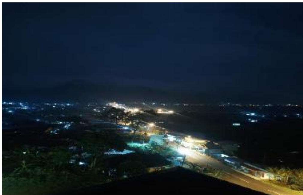
View Bukit Bintang