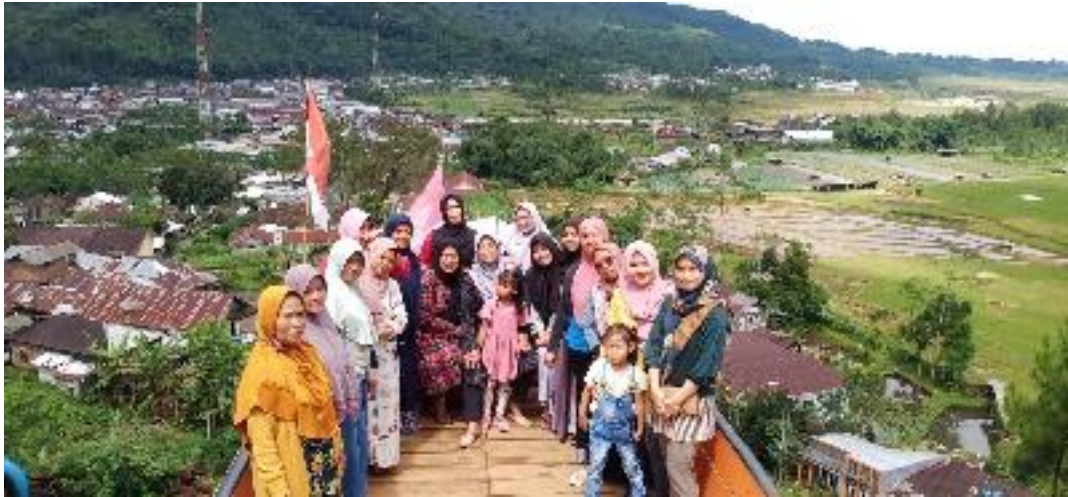
Kegiatan ibu-ibu Wali Murid SD