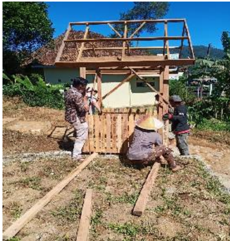
Pembangunan Locket Wisata