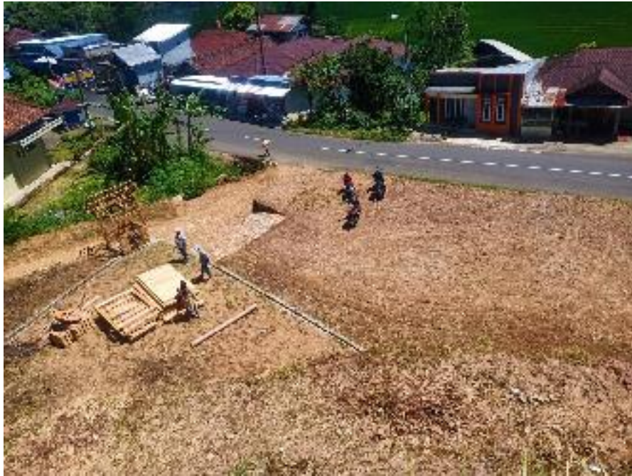
Pembangunan Tempat Parkir