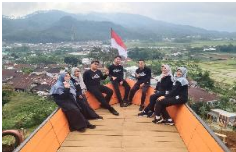
Pemuda Penggiat Wisata Wonderful Kalibening