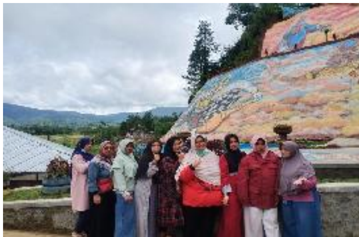
Kunjungan dari Wali Murid SDN 1 Kalibening