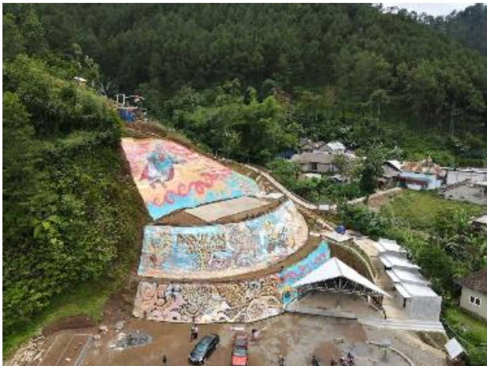
View Parakan Paradise melalui Camera Drone Dokumentasi Pribadi, 2022