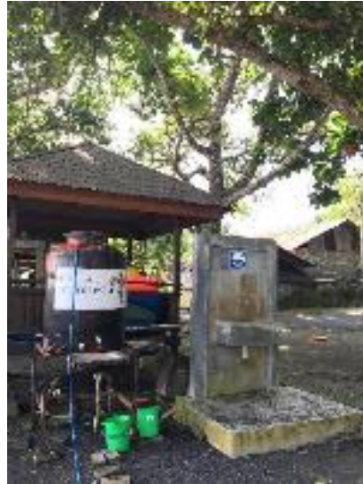
Tempat Cuci Tangan