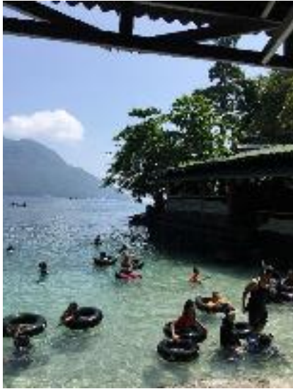
Aktivitas Renang di Pantai