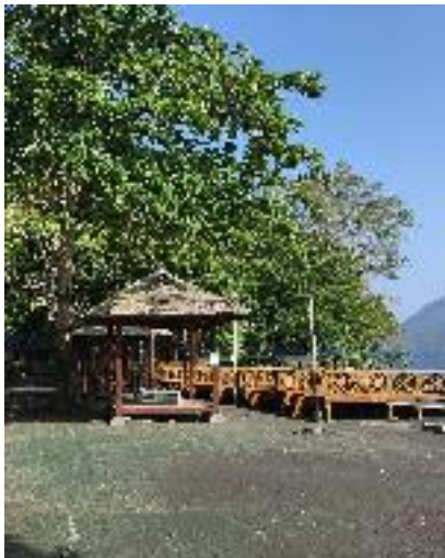
Gazebo Pantai Sulamadaha