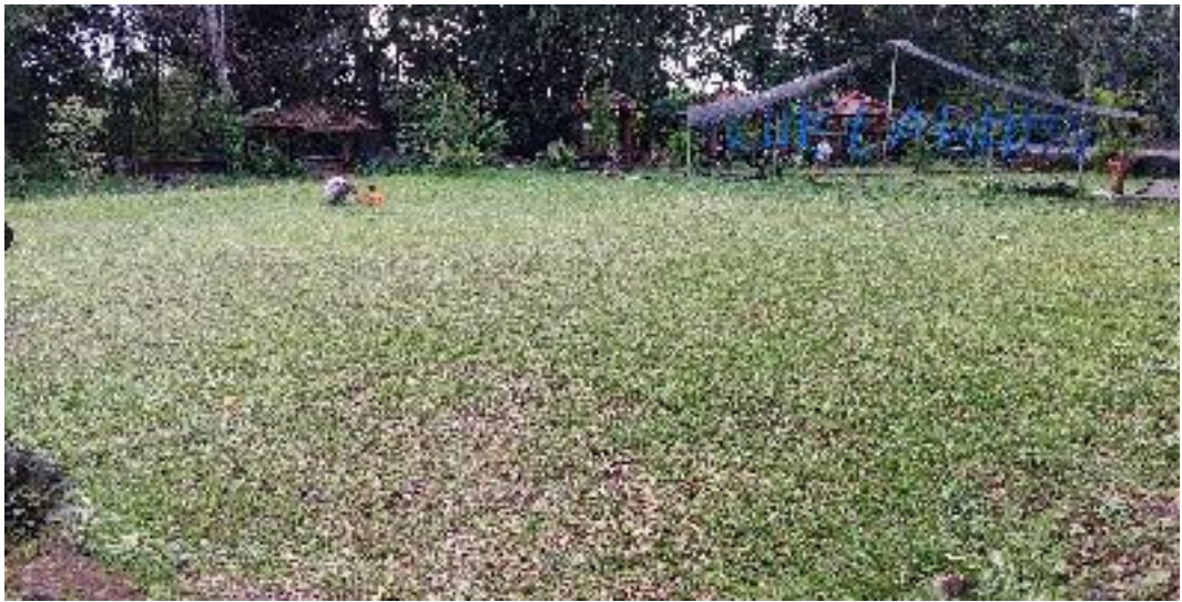
Area upacara adat murti sumber dan tempat camping ground destinasi Blue Lagoon