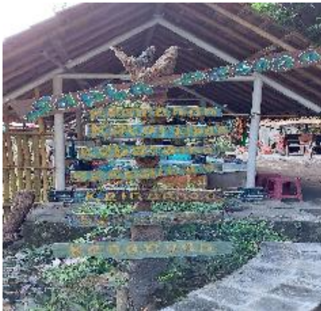
Sapta pesona destinasi Blue Lagoon