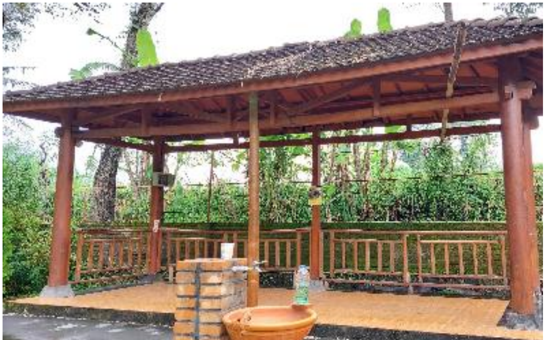
Gazebo destinasi Blue Lagoon