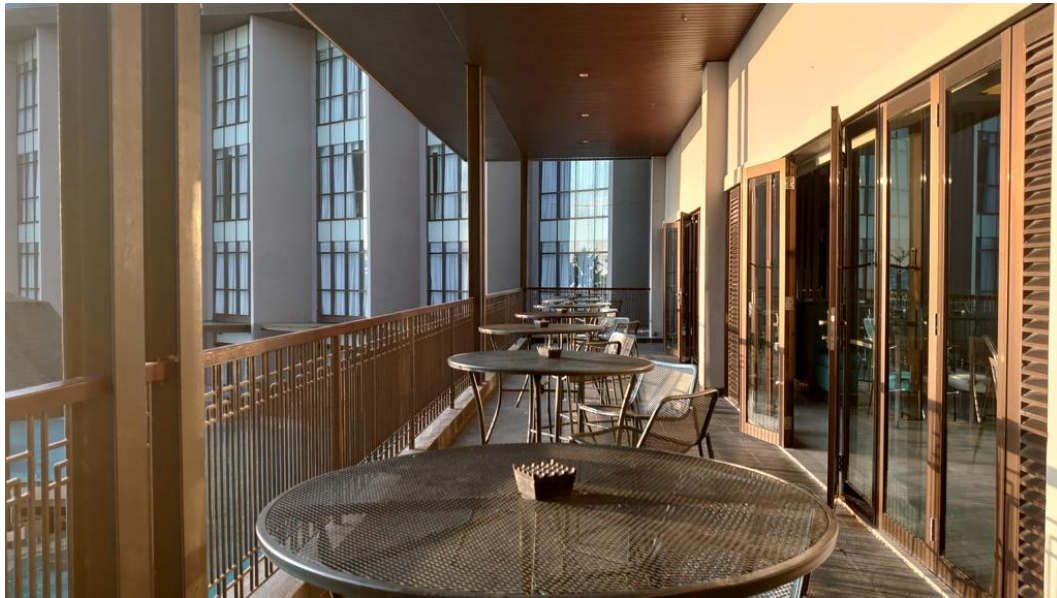
Kava Restoran ( Balcony )