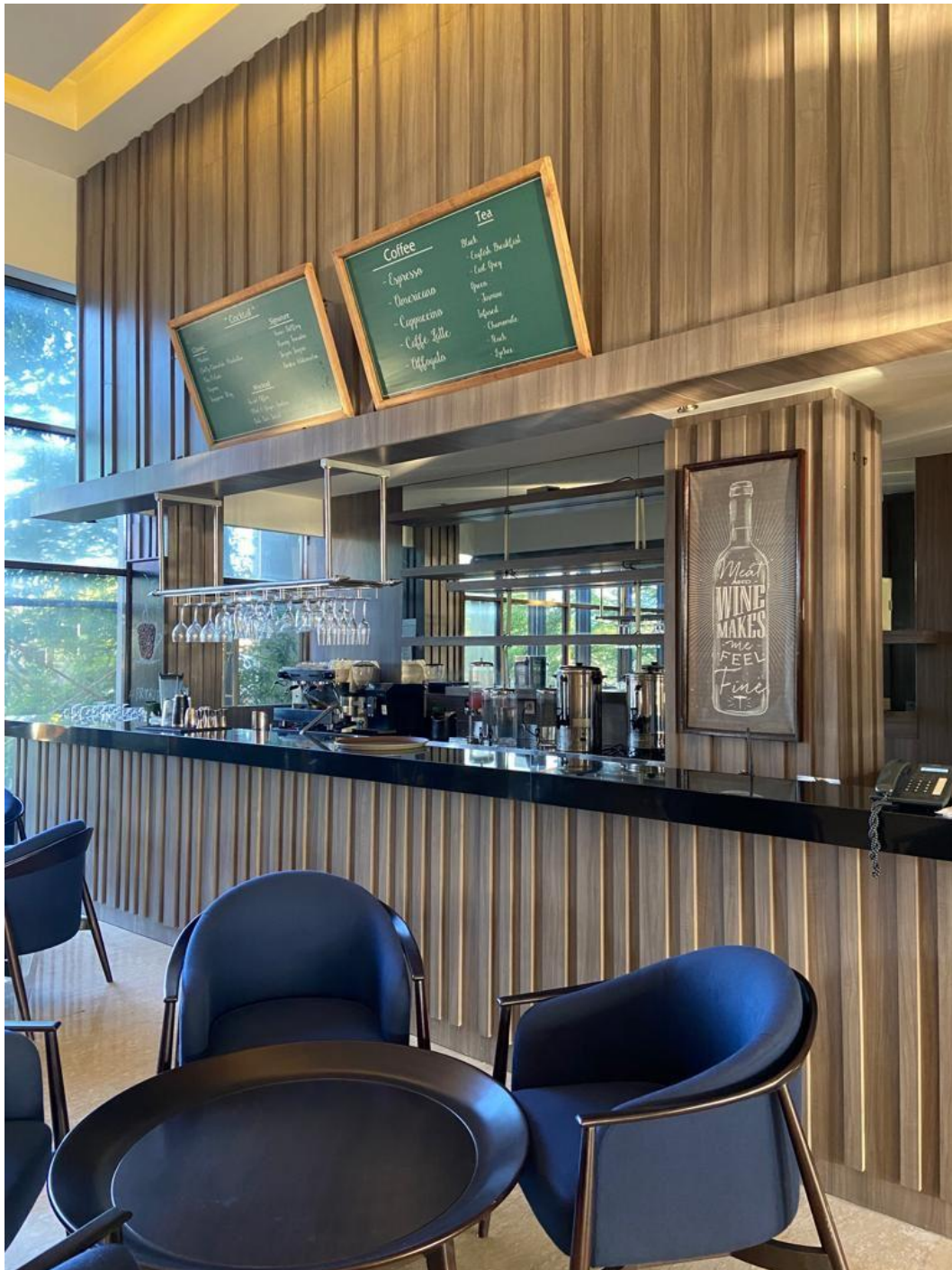
Mini Bar at Kava Restoran