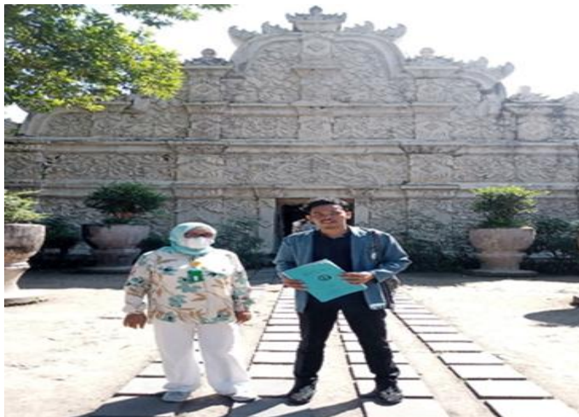
Gambar: Dokumentasi dengan pramuwisata Taman Sari Yogyakarta