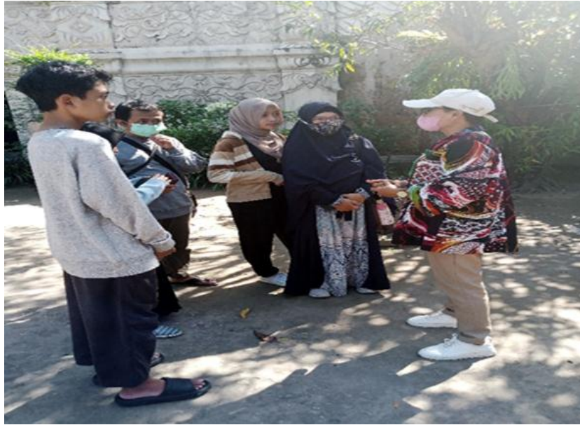
Gambar: Dokumentasi pramuwisata Taman Sari memberikan Informasi kepada wisatawan