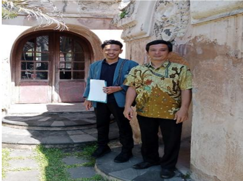
Gambar: Dokumentasi dengan pramuwisata Taman Sari Yogyakarta

Foto dokumentasi dengan pramuwisata Taman Sari Yogyakarta