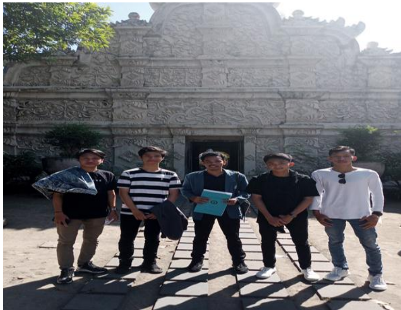
Gambar: Dokumentasi dengan wisatawan yang melakukan Kunjungan wisata Taman sari Yogyakarta