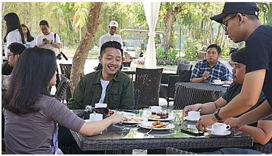
Gathering Coffee Break