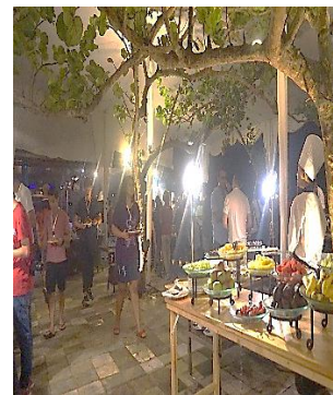
Standing Coffee break