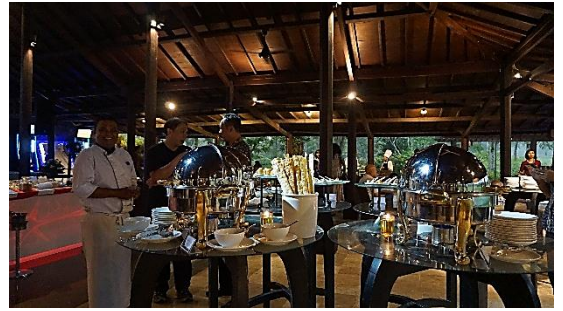
Prepare before coffee break