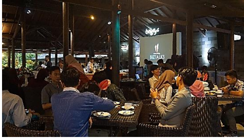
Coffee break at bogeys terrace