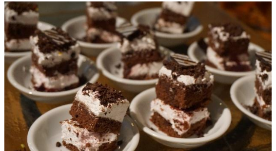
Black Forest Cake