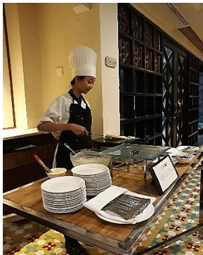
Live coffee break