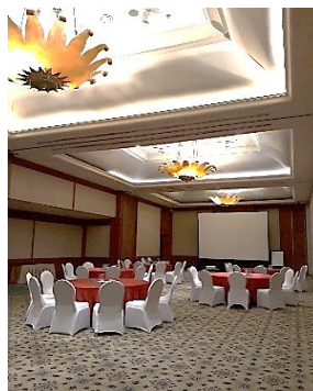
Ballroom coffee break