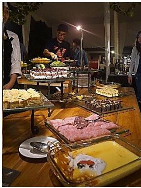
Menu pastry di coffee break