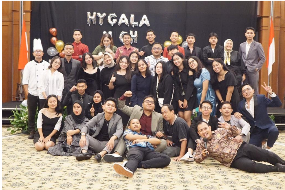
Farwell Trainee Hyatt Regency Yogyakarta