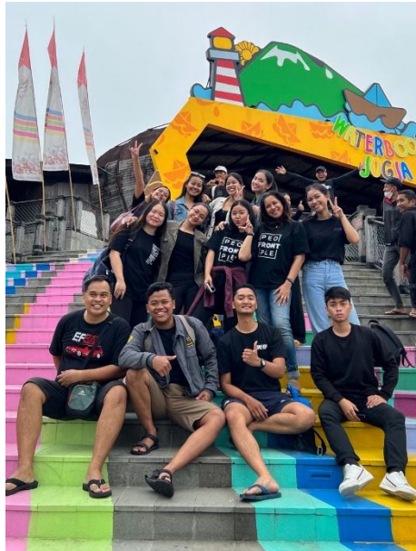
Outing Front Office team