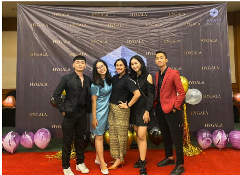
Trainee Front Office dengan Front Office Manager.