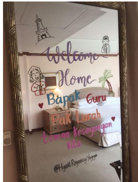
Contoh-contoh doodle glass yang dibuat oleh penulis.