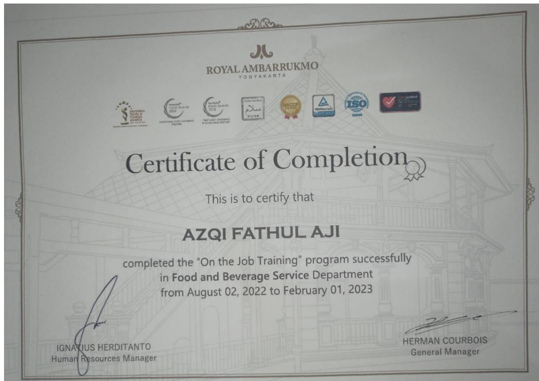
Sertifikat Praktek Kerja Lapangan