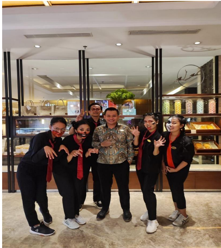
Halloween Punika Deli