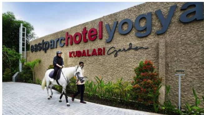
Kuda Lari Garden