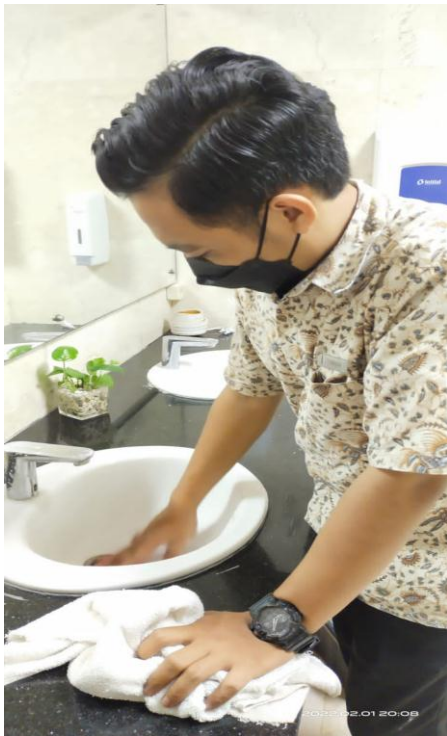
FOTO KEGIATAN SELAMA PKL