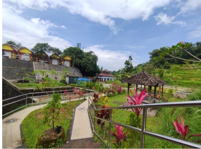
Gambar 1.1 Gambar Wisata Tandung-andung