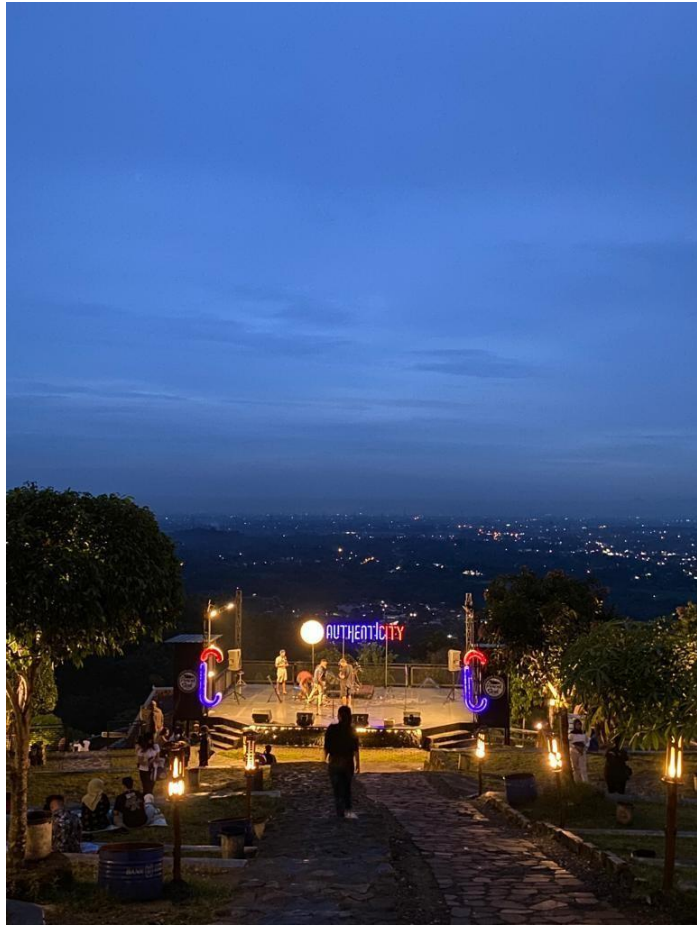
Live Musik di Puncak Sosok