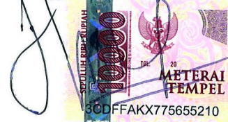
Hasbi Ash Shiddieqy