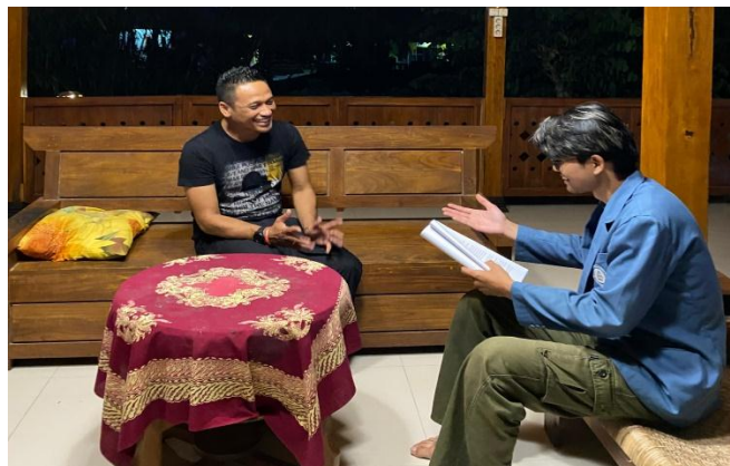
Sumber: Data Primer, 2023