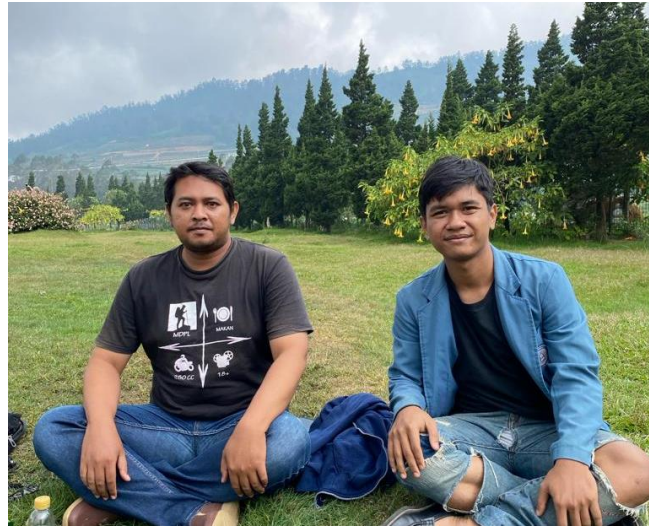
Wawancara dengan Islah selaku wisatawan