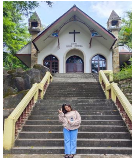
Kapel Taman Doa Gua Maria Sendang Ratu Kenya