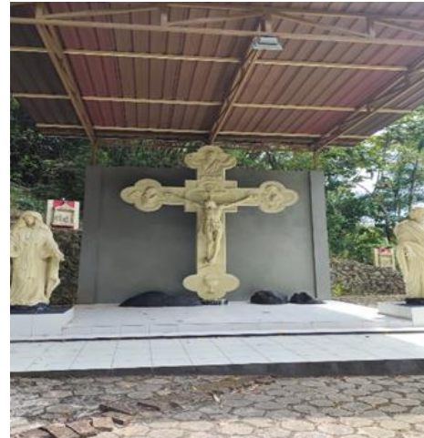
Salib Tuhan Yesus