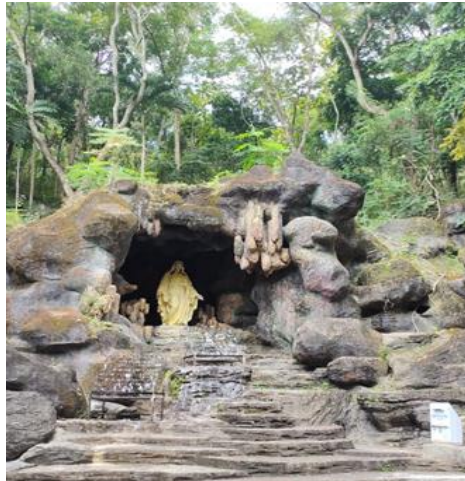
Lokasi Taman Doa Sendang Ratu Kenya