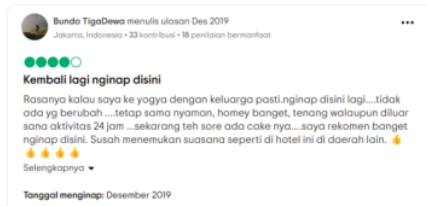
Gambar 4. Review Comment pada Tripadvisor

Instrumen tangible dapat dimaknai sebagai upaya penerima layanan dalam memberikan penilaian terhadap layanan yang mereka terima. Tamu hotel dapat memberikan penilaian melalui akses yang disediakan pihak hotel seperti: lembar komentar hingga akses review comment yang dapat diakses dan dilihat secara digital.