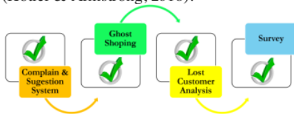
Gambar 3. Mengetahui Kepuasan Penerima Layanan

kepuasan, begitupun sebaliknya. Struktur organisasi tradisional menjelaskan jika hanya staff digaris terdepan saja yang bersinggungan dengan pelanggan. Hal ini menegaskan jika pelanggan tidak punya pilihan lain dalam menyampaikan keinginan dan kebutuhannya (Raghuvanshi & Garg, 2018). Perkembangan berikutnya menggambarkan bagaimana organisasi bersaing dengan kompetitor melalui layanan yang diberikan. Kondisi tersebut secara langsung merubah struktur organisasi dalam memberikan layanan. Semua bagian yang ada dalam organisasi memiliki kewajiban yang sama dalam merespon pelanggan (Kotler & Armstrong, 2018).