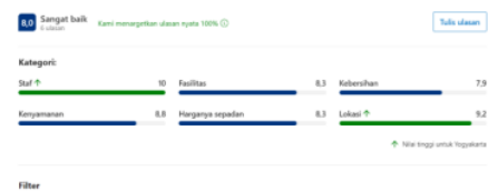
Gambar 1. Ulasan Tamu di Booking.com

Kirana hotel merupakan salah satu penyedia layanan akomodasi di Yogyakarta. Hotel ini berada dikawasan Prawirotaman atau ring dua dan dapat menjadi salah satu alternatif pilihan. Fokus pada layanan yang diberikan, menjadikan hotel ini mendapat apresiasi positif dari tamu. Berbagai layanan yang merupakan tanggung jawab harus dilaksanakan dengan baik. Hotel ini juga memiliki guest relation officer (GRO) dengan tugas yang kompleks. Komunikasi dengan tamu dilakukan sebelum mereka check in , selama tamu tinggal dan ketika mereka check out .