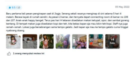
Gambar 6. Ulasan tamu melalui Traveloka

Penilaian serupa juga diberikan oleh sdr I Awalia melalui portal Traveloka. Tamu tersebut memberikan penilaian terhadap sajian kuliner. Lebih lanjut, hotel Kirana juga memberikan informasi, rekomendasi serta arahan lain yang dapat diakses oleh anak-anak selama mereka menginap. Layanan hotel kirana melakukan upselling serta memberikan penawaran informasi lain yang sebelumnya tidak terfikirkan oleh tamu.