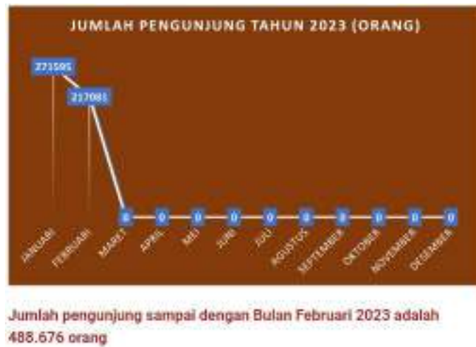
Gambar 1.2. Data Pengunjung Teras Malioboro

Memang kebanyakan masih didominasi oleh Wisnus (Wisatawan Nusantara) tetapi banyak juga Wisman yang berlibur untuk menikmati libur musim panas mereka. Antusias pengunjung terlihat saat sesekali berhenti di beberapa spot untuk melihat-lihat barang dagangan. Ada juga yang hanya melihat-lihat sembari berswafoto.