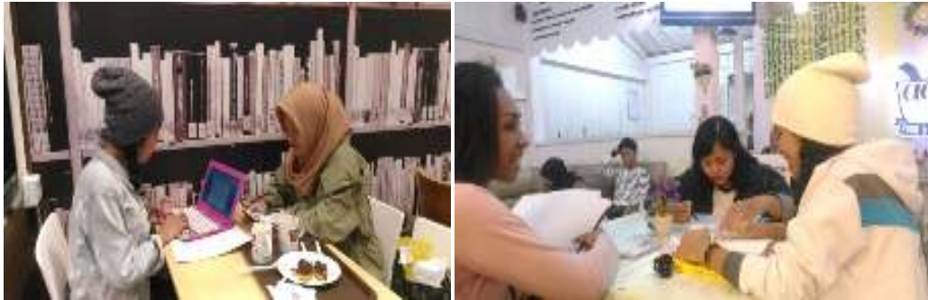
Dokumentasi wawancara pembaca buku The Naked Traveler