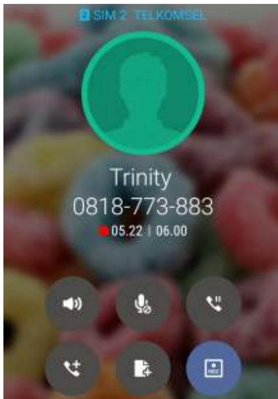
Dokumentasi wawancara bersama penulis via telepon seluler