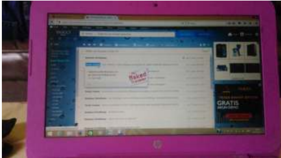
Dokumentasi Konfirmasi Wawancara Penulis Via Email The Naked Traveler