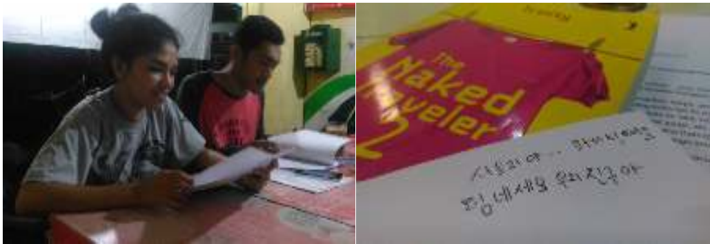
Dokumentasi wawancara pembaca cerita Labuan Bajo Indah Nan Lucu dalam The Naked Traveler 2