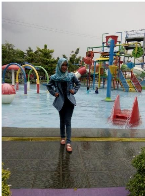
Kolam Anak