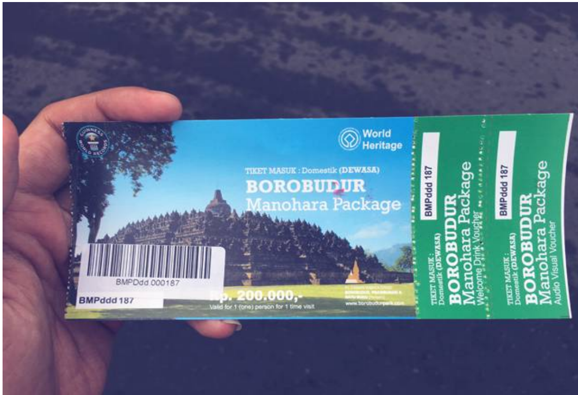
Sumber : Manohara Center of Borobudur Study