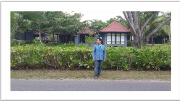
Villa Lord In Belitung