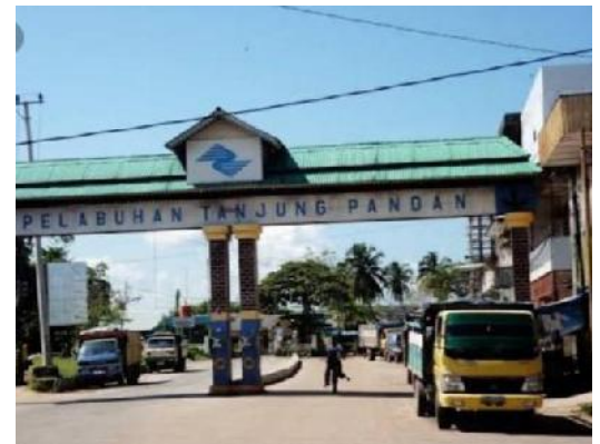
Pelabuhan Tanjung Pandan Belitung