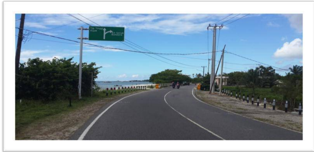
Papan Petunjuk Arah dan Jaan Menuju ke Lokasi Pantai Tanjung Tinggi.