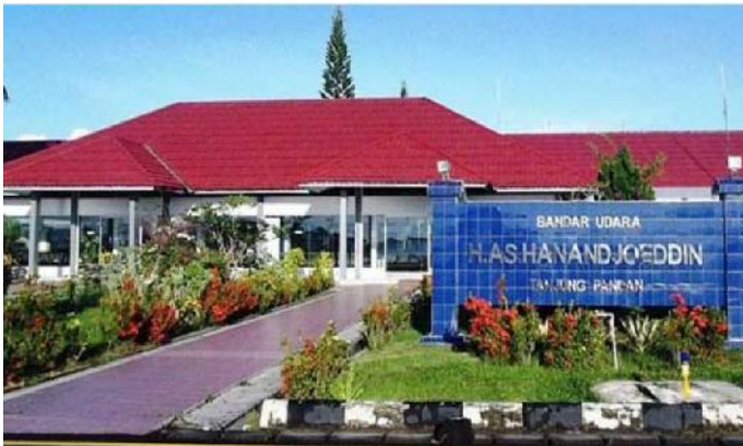
Bandara H.AS Hanadjodi Kabupaten Belitung