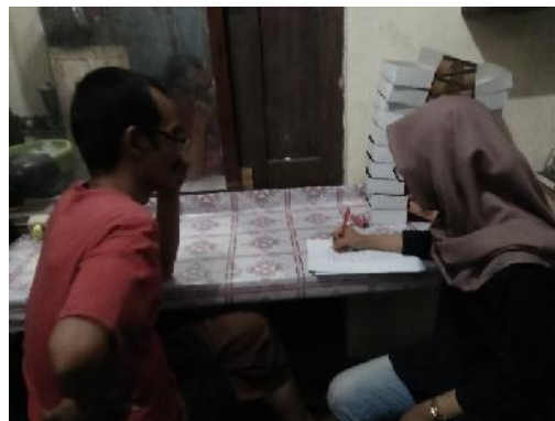
Peneliti Melakukan Wawancara Dengan Narasumber