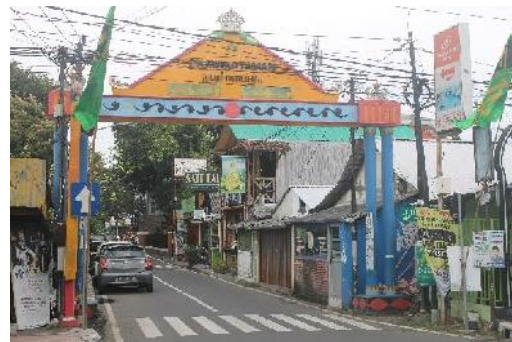
Gapura Kampung Wisata Prawirotaman