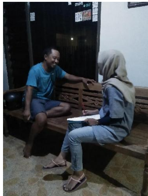
Peneliti dengan Bapak RT dan RW Kampung Wisata Prawirotaman