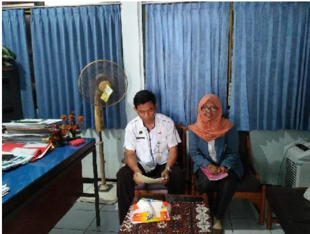
Peneliti dengan Bapak Lurah Kelurahan Brontokusuman