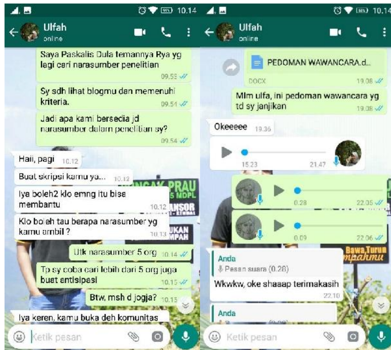
Dokumentasi wawancara dengan Ulfah Fauziyah DK via whatsapp