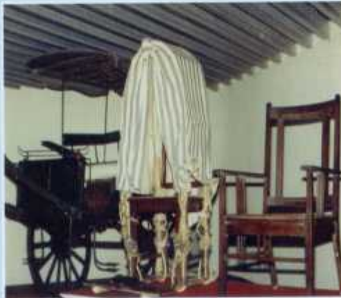
Tandu dan doker yang pernah dipergunakan Panglima Besar Jendral Soedirman (Museum 2).

Di lantai I terdapat empat ruang Museum yang menyajikan benda-benda koleksi berupa: Realia, Replika, Foto, Dokumen, Heraldika, berbagai jenis Senjata, bentuk Evokatif Dapur Umum, yang kesemuanya menggambarkan suasana Perang Kemerdekaan 1945-1949.