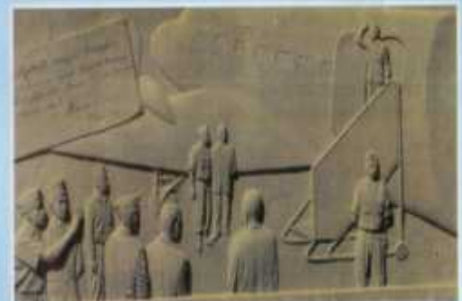
Presiden Soekarno kembali ke Jakarta, 28 Desember 1949 (Relief 40)

Lapik luar dinding langkan lantai II yang melindungi tubuh monumen, disajikan 40 buah relief perjuangan fisik dan diplomasi perjuangan bangsa Indonesia sejak 17 Agustus 1945 hingga 28 Desember 1949.