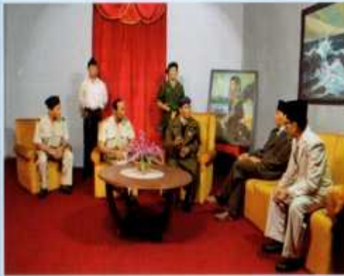
Panglima Besar Jenderal Soedirman tiba kembali di Yogyakarta, 10 Juli 1949 (Diorama 9)

Di ruang dalam lantai II disajikan 10 diorama episode perjuangan fisik dan diplomasi bangsa Indonesia sejak 19 Desember 1948 hingga 17 Agustus 1949 dengan ukuran life size.