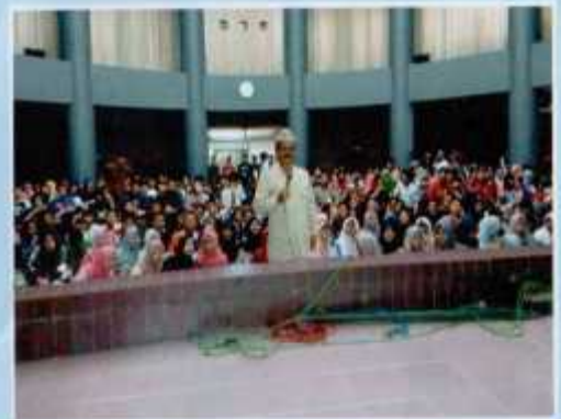
Suasana pemanduan bagi rombongan pengunjung

Berada di lantai I, terletak di tengah-tengah ruangan/ bangunan induk dilengkapi dengan panggung terbuka. Ruang ini biasa dipakai untuk memberikan panduan bagi rombongan pengunjung yang menginginkan penjelasan tentang Monumen Yogya Kembali, pemutaran film dokumenter; Ruang Serba Guna Monumen Yogya Kembali juga bisa dipakai untuk kegiatan wisuda, seminar, lomba menari dll. Ruang ini dilengkapi dengan fasilitas kursi, AC, sound system, proyektor (LCD dan layar).