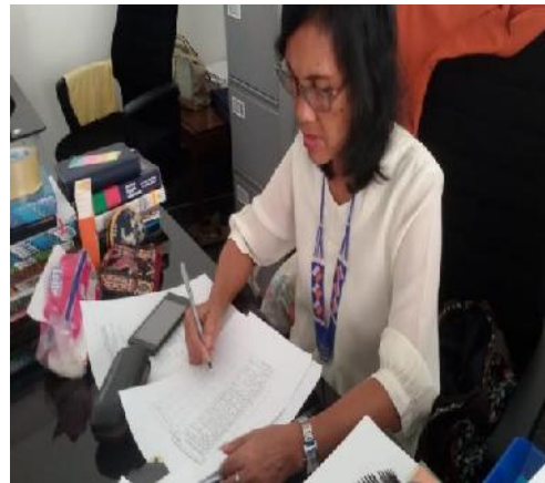
Foto saat pengambilan kuisisioner