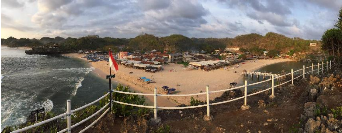
(Keindahan Pantai Drini dilihat dari Pulau Drini, 22 Desember 2019)