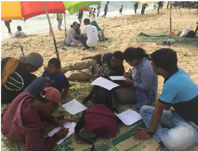
(Wisatawan yang mengisi kuesioner peneliti, 22 Desember 2019)