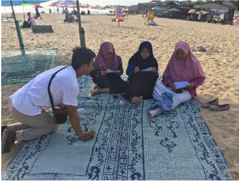
(Wisatawan yang mengisi kuesioner peneliti, 21 Desember 2019)