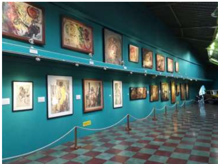
Gambar 1.1 Tampilan koleksi seni lukis di Museum Affandi Sumber : Dokumentasi Pribadi 2018

Museum Affandi terdiri dari empat galeri. Galeri pertama berisikan tempat penjualan tiket dan pusat informasi, galeri kedua berisi lukisan-lukisan Affandi yang dijual, galeri 3 berisikan ruang pameran lukisan dari pelukis lain di Indonesia dan galeri 4 berisikan karya lukis dari keluarga Affandi. Museum ini mulai diresmikan oleh Affandi pada tahun 1974.