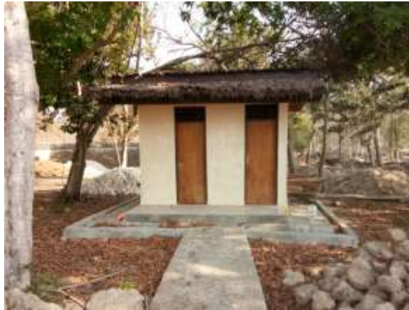
Toilet Di Pantai Konda Maloba