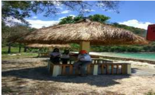
Gazebo Di Pantai Konda Maloba