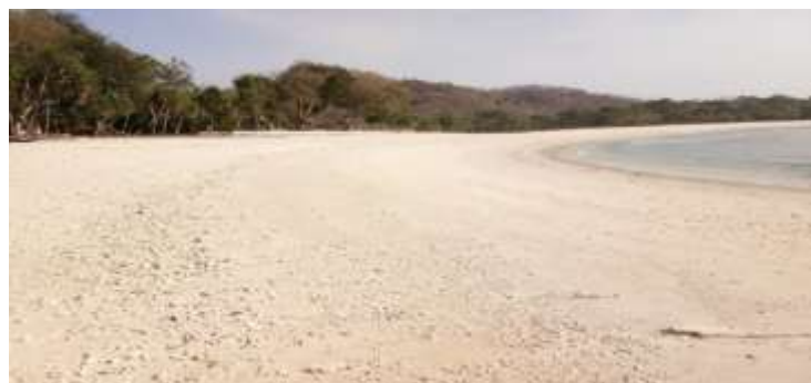
Hampan Pesisir Pantai Konda Maloba