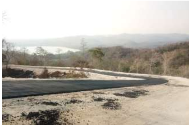
Sebagian Akses Jalan Pantai Konda Maloba Telah Di Perbaiki