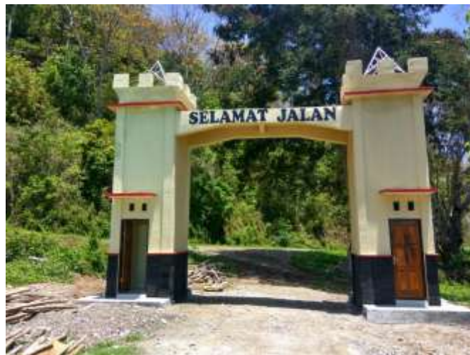
Gapura Di Pantai Konda Maloba