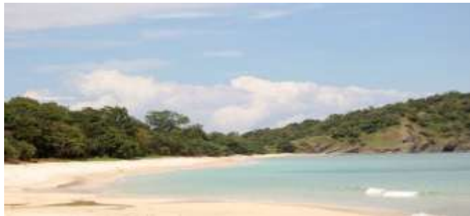
Hampan Pantai Konda Maloba