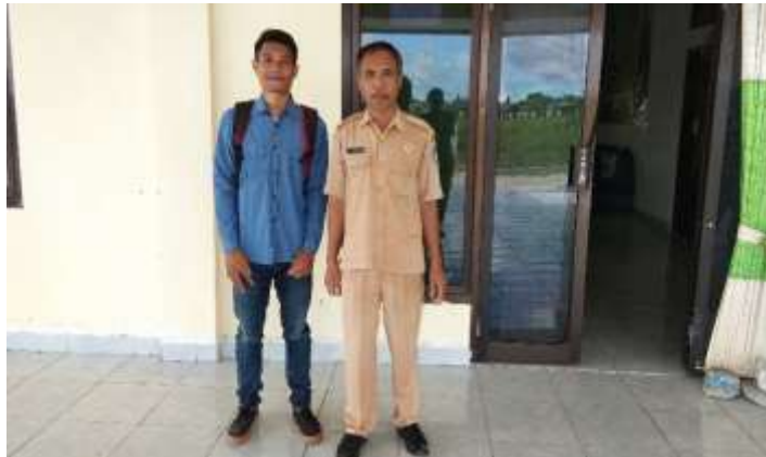
Dokumentasi Setelah Habis Wawancara Sub Kepala Bagian Perencanaan Dinas Pariwisata