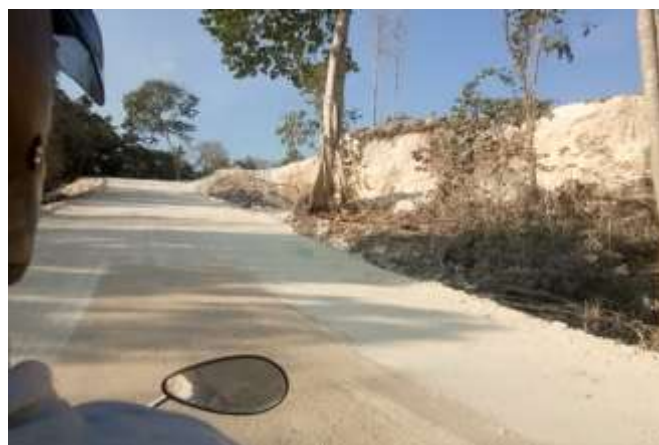
Akses Jalan Menuju Pantai Konda Maloba Dalam Proses Perbaikan