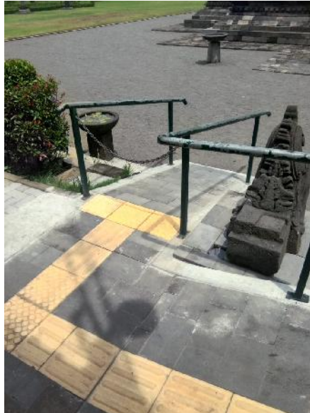
Fasilitas Jalur Difabel Bagi Wisatawan Berkebutuhan Khusus Yang Ingin Berwisata Ke Candi Mendut.