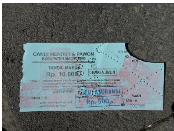
Tiket Terusan Candi Mendut dan Candi Pawon.