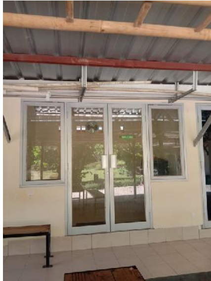
Sumber : Dokumentasi Pribadi Musholla Yang Berada Didalam Area Candi.