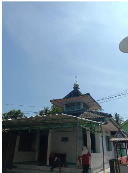
Musholla di Area Candi Mendut.