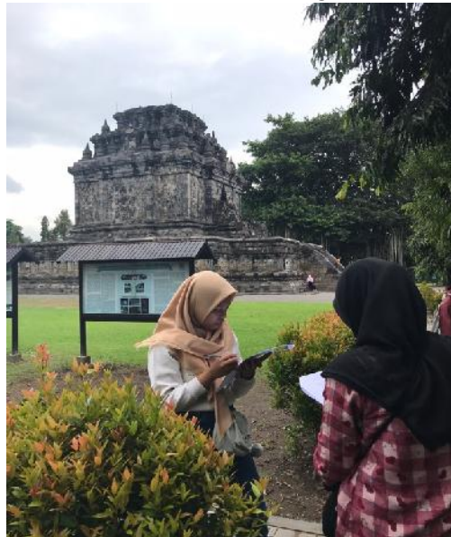
Sumber : Dokumentasi Pribadi Wisatawan Candi Mendut Mengisi Kuesioner.