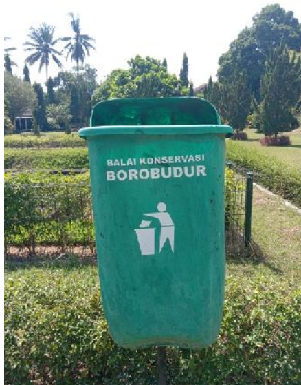
Sumber : Dokumentasi Pribadi Fasilitas Kebersihan Tempat Sampah.