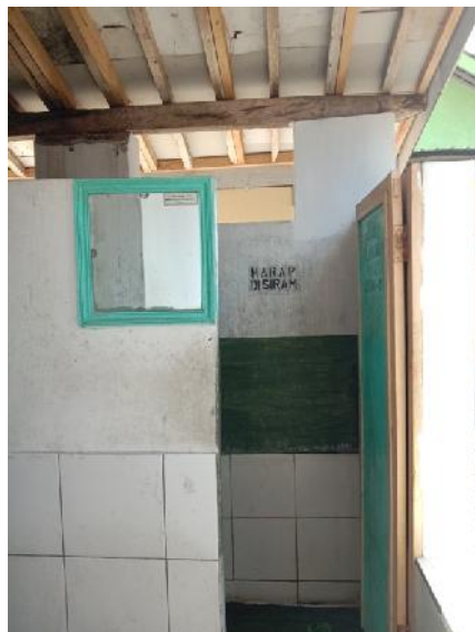
Sumber : Dokumentasi Pribadi Toilet Umum Yang Berada di Area Candi.