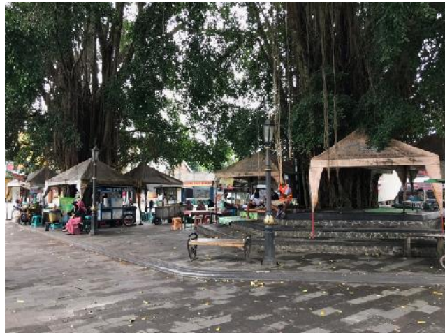
Area Pedagang Makanan di Candi Mendut.