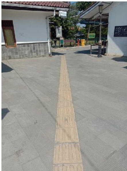
Fasilitas Jalur Difabel Bagi Wisatawan Berkebutuhan Khusus Yang Ingin Berwisata Ke Candi Mendut.