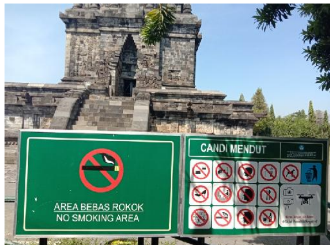
Papan Peringatan Yang Tidak Boleh Dilakukan Wistawan Saat Berkunjung.