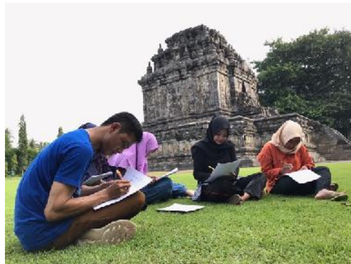
Sumber : Dokumentasi Pribadi Wisatawan Candi Mendut Mengisi Kuesioner.