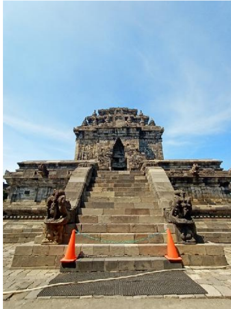
Kemegahan Candi Mendut.