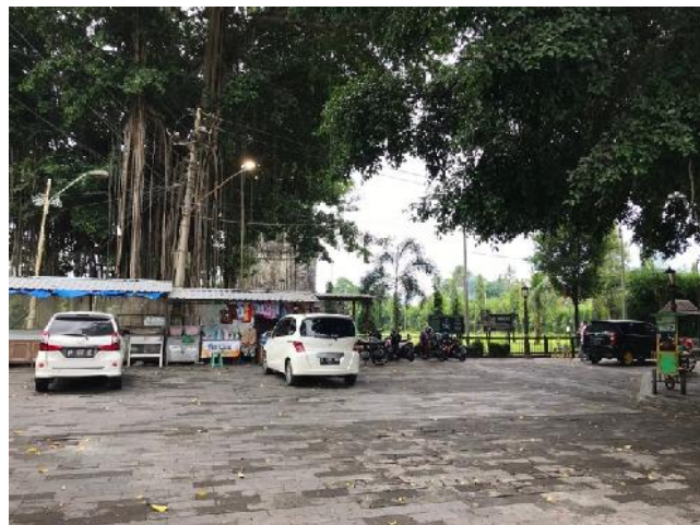
Lahan Parkir di Area Cand