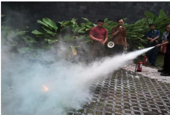
Training Pemadaman Kebakaran