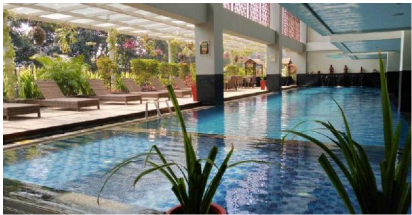
Telaga Warna Pool