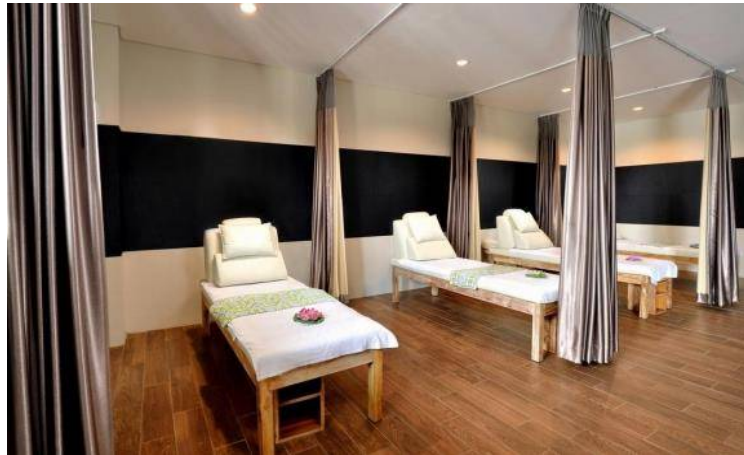
Putri Kedhaton Spa