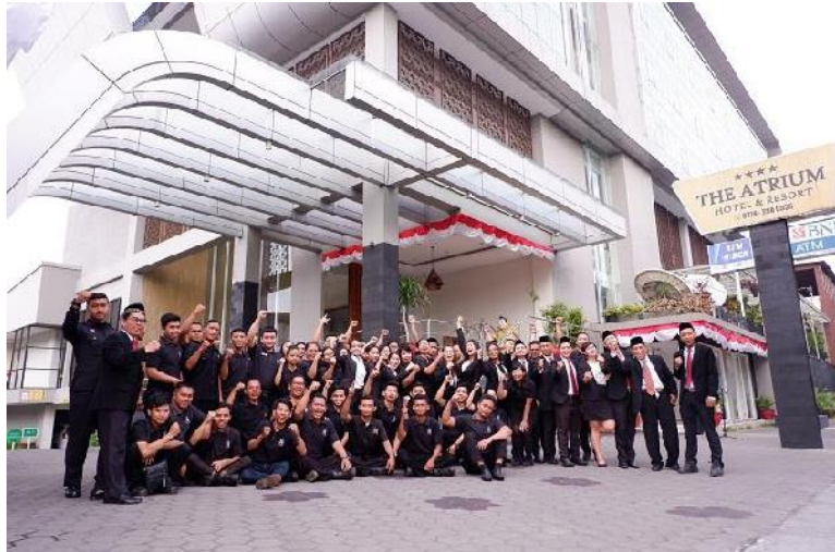
Peringatan Hut RI ke 74