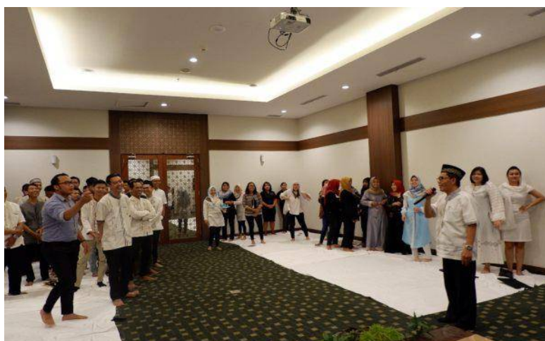
Character Building dan Sholat Berjama'ah