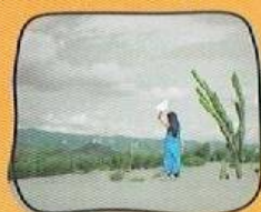
PARANGKUSUMO SAND DUNES