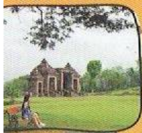
CANDI RATU BOKO