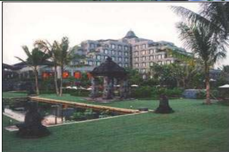
Bentuk Bangunan Hyatt Regency Yogyakarta.