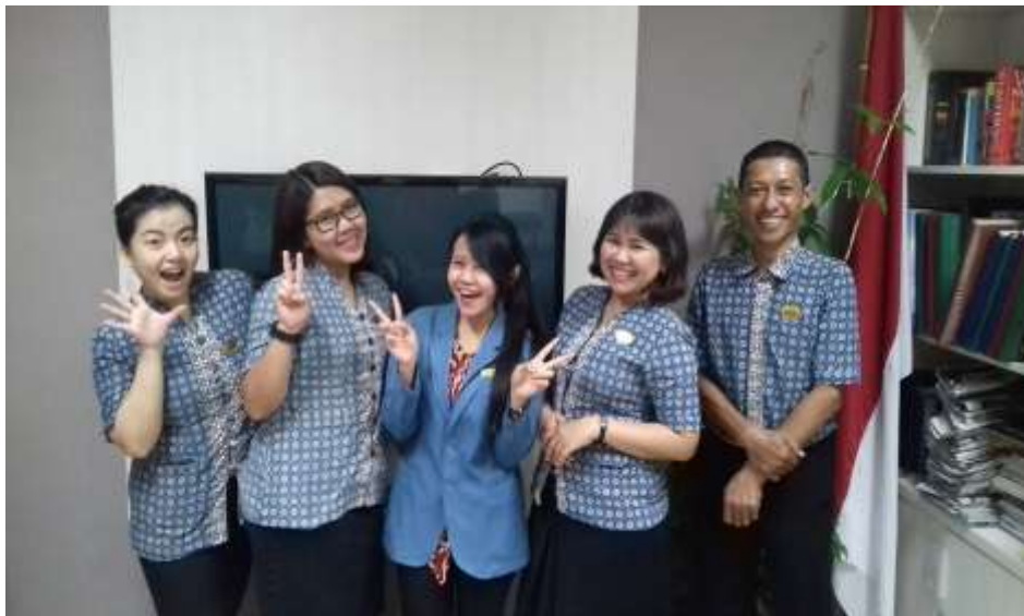
Penulis bersama Team HRD Hyatt Regency Yogyakarta.