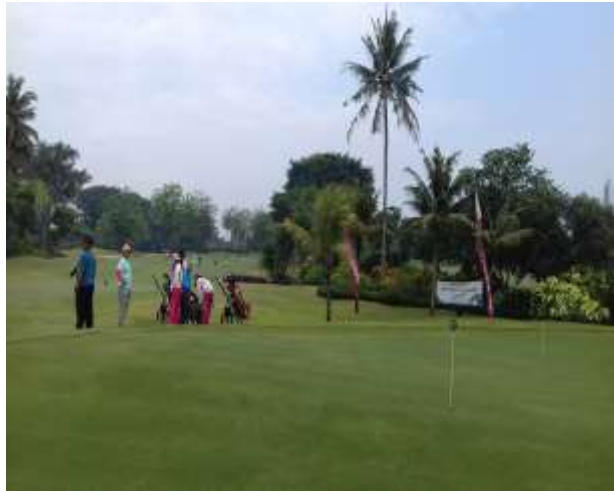
Lapangan Golf Hyatt Regency Yogyakarta