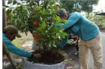
Aksi Gerakan "Green Jogja" & "Clean Jogja/Anti Vandalisme"