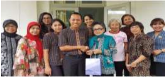
Sumbangan kepada YKI

Liked by ayucornellia, andrepmks and 42 others dhek_winda This is what we do as a real caring. Setelah Pink Ribbon Run 2017 kemarin selesai, kami sowan ke Yayasan Kanker Indonesia untuk menyumbangkan keseluruhan profit dari acara tersebut. Bahagiannya hati ini, karena kami berhasil menyumbang lebih banyak lagi tahun ini. Tidak hanya itu saja, kami juga bahagia karena bisa menjadi penyalur berkat bagi orang lain, terutama pejuang kanker payudara. Terima kasih yaaa untuk temen2 yang udah ikut lari, para sponsor, temen2 yg buka booth. Inilah berkat untuk kita semua. Ehm buat saya pribadi, caring bukan hanya karena kita mau sharing, namun juga it's relieving. Relieving myself and relieving other people. So do not stop to be care to others.