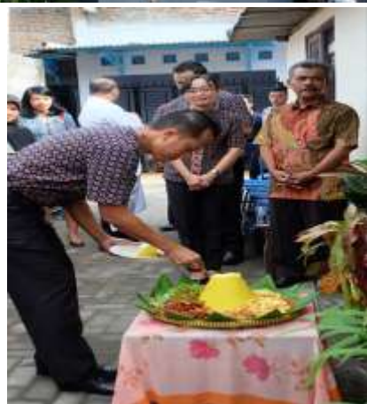
Aksi "Bedah Rumah" oleh Hyatt Regency Yogyakarta.