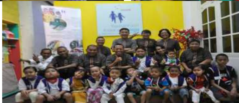
Bentuk Dukungan kepada anak-anak penderita kanker di YKAK Jogja berupa sumbangan uang, alat belajar, alat bermain dan gerakan "Aksi Berani Gundul" oleh Hyatt Regency Yogyakarta.