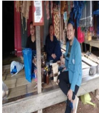
Gambar 4.4 Souvenir Di sentral Desa Wisata Baduy Luar Lebak Banten