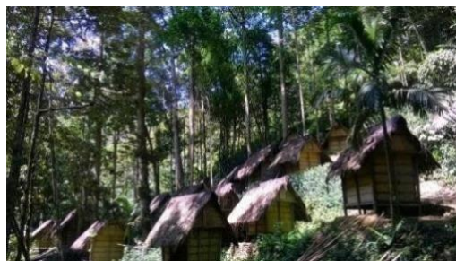
Gambar 4.2 Masyarakat Baduy Luar Lebak Banten