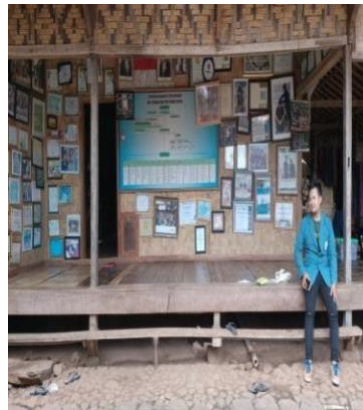
Gambar 4.7 rumah adat Di Desa Wisata Baduy Luar Lebak Banten

Amerika Serikat, atau suku Incha di Manchu Pichu Peru. Khasanah budaya masyarakat Baduy cukup menarik untuk dilakukan wisata penelitian antropologi, karena kehidupan masyarakat itu hingga kini masih mempertahankan adat leluhurnya. Masyarakat Baduy hingga kini masih mempertahankan adat istiadat dan menolak kehidupan moderen.