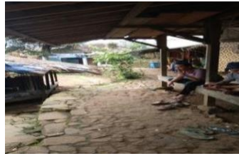
Gambar 4.5 Jalan setapak Di Desa Wisata Baduy Luar Lebak Banten