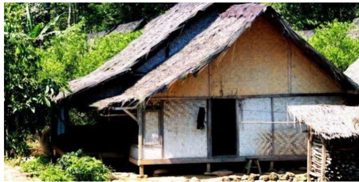
Gambar 4.6 lembur terdepan Di Desa Wisata Baduy Luar Lebak Banten