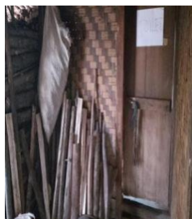
Gambar 4.8 Toilet Umum Di Desa Wisata Baduy Luar Lebak Banten

Untuk memenuhi kebutuhan wisatawan, di Desa Wisata Baduy Luar Lebak Banten juga terdapat beberapa toilet umum. Toilet umum tersebut terdapat di beberapa titik.