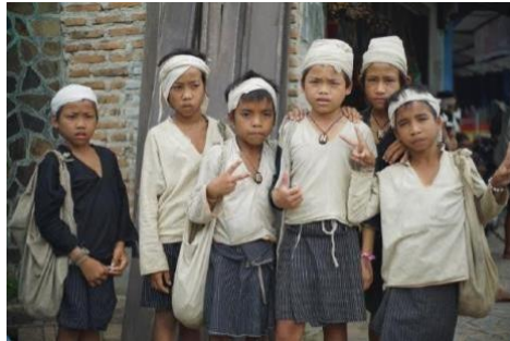
Gambar 4.1 Masyarakat Baduy Luar Lebak Banten

tanam. Oleh karena itu, mengenal Suku Baduy Dalam dan Luar bukan hanya sekadar memberi wawasan penting mengenai budaya murni yang masih hidup di nusantara, tapi juga mengajarkan makna kehidupan soal keselarasan hidup melalui nilai budaya yang diterapkan oleh masyarakatnya.