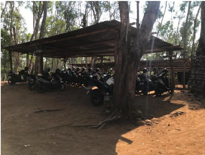
Gambar 08, tempat parkir motor.