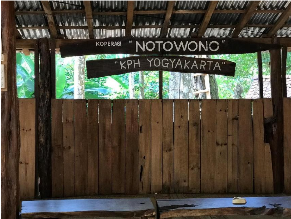
gambar 06, ruang rapat Koperasi Notowono.