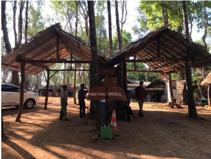
gambar 07, pintu masuk parkir motor dan mobil.