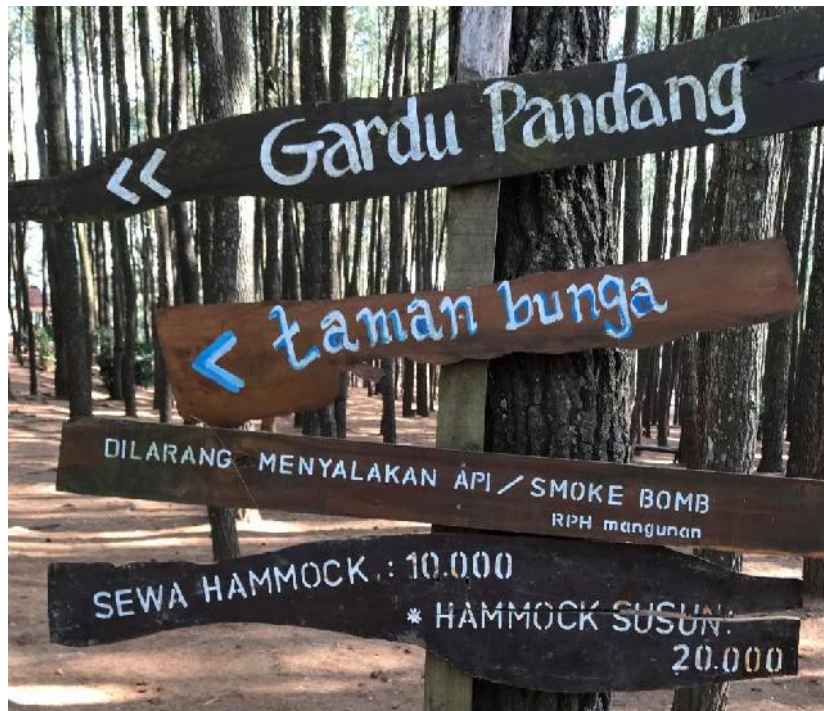
Gambar 11, papan petunjuk arah dan informasi.