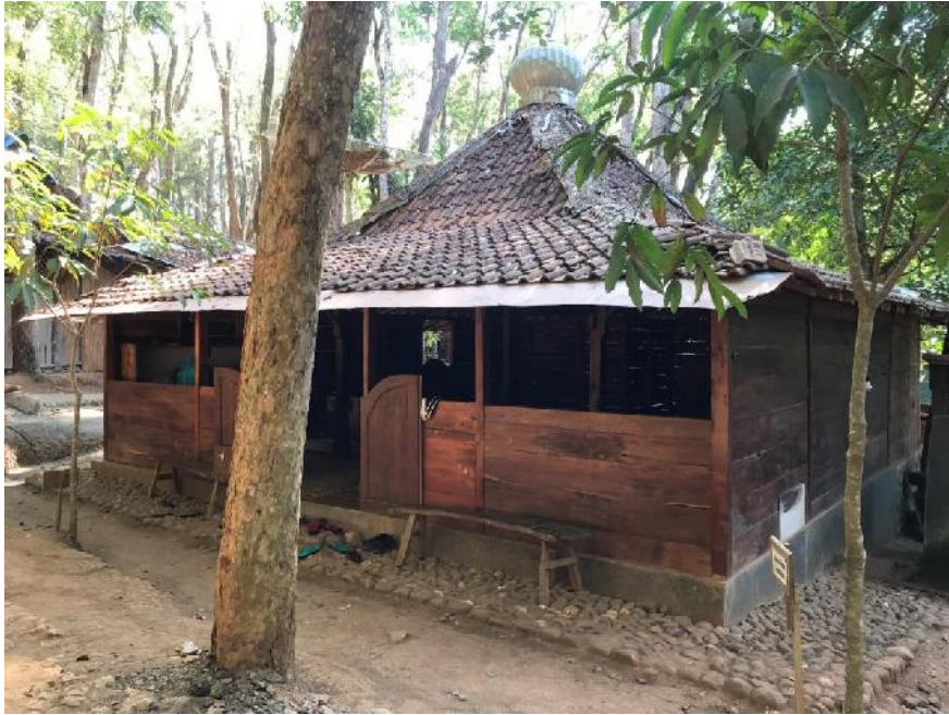
Gambar 09, mushola di Kawasan Wisata Hutan Pinus Mangunan.