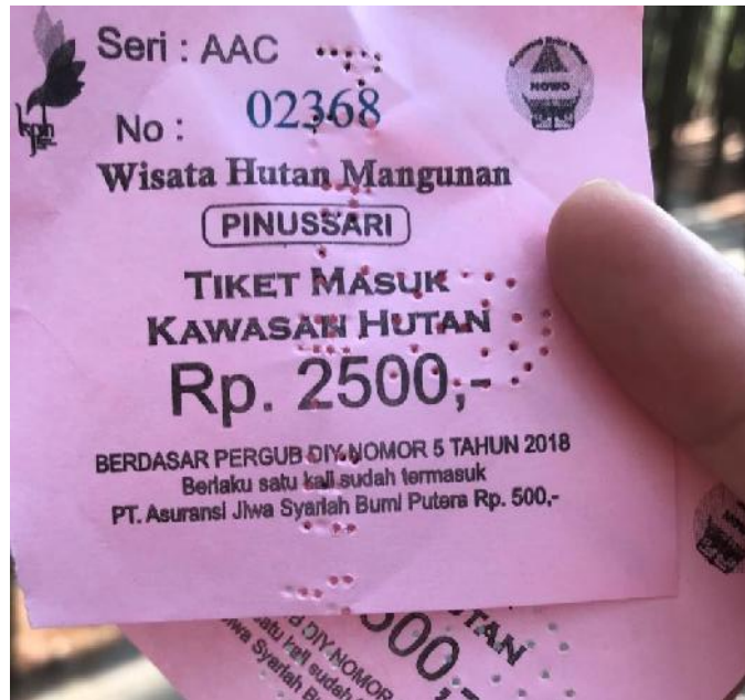
Gambar 02, tiket masuk Kawasan Wisata Hutan Pinus Mangunan.