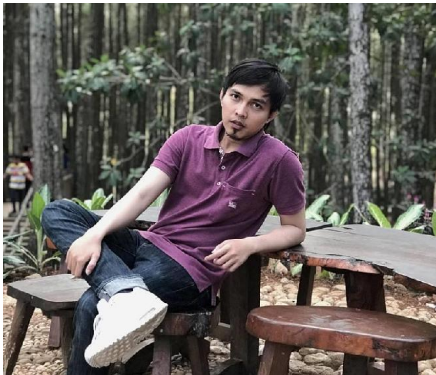
Gambar 12, foto peneliti di salah satu photo spot di Kawasan Wisata Hutan Pinus Mangunan.