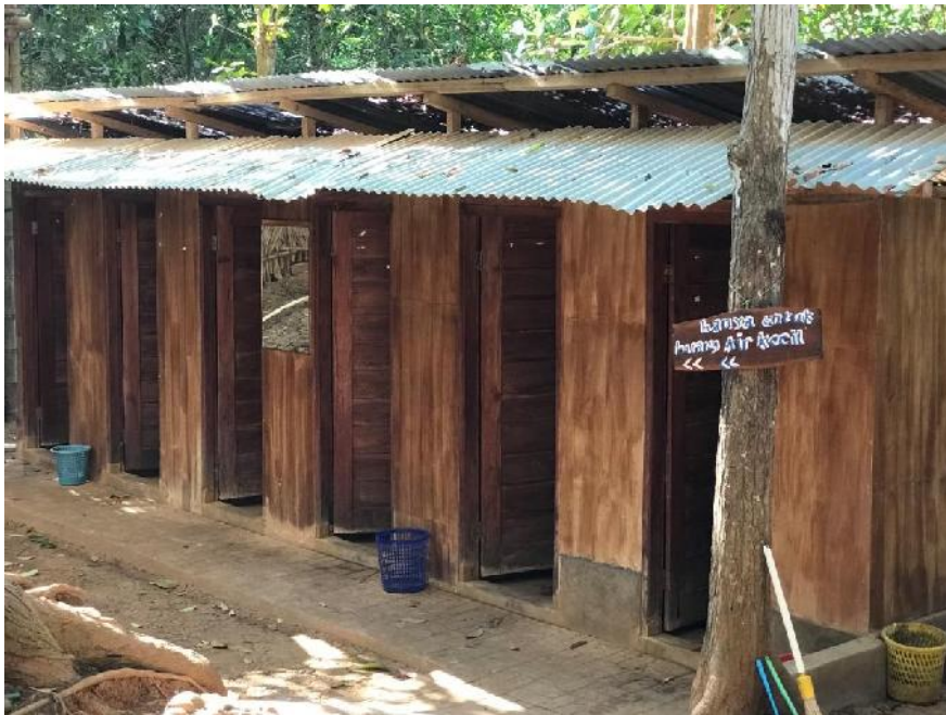
Gambar 10, fasilitas toilet di Kawasan Wisata Hutan Pinus Mangunan.