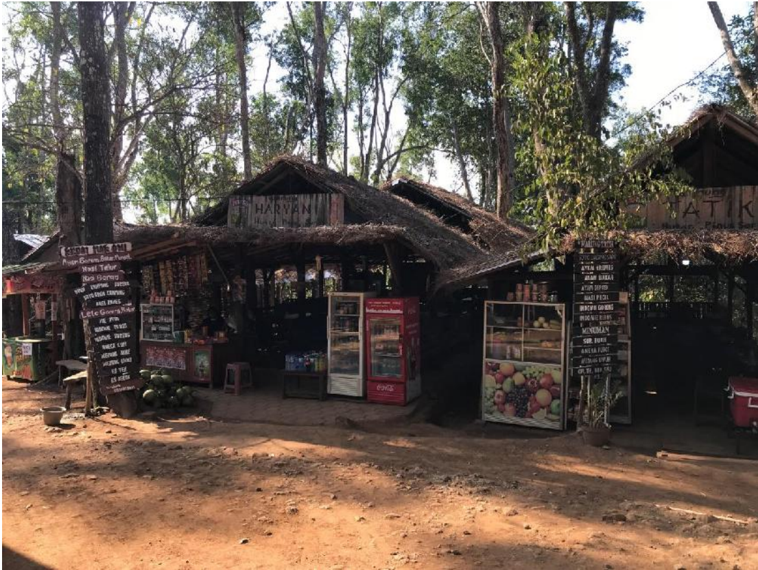
gambar 05, beberapa rumah makan di Kawasan Wisata Hutan Pinus Mangunan.